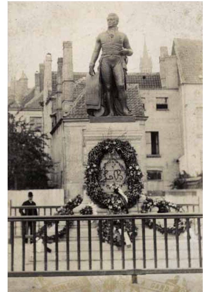
Het standbeeld van Lieven Bauwens met de bloemenkransen van de inhuldiging in 1885.

De anekdotes waren misschien minder kleurrijk dan het verhaal van Sies Van Oost of dat van het verstoten meisje, ze probeerden echter des te duidelijker te maken dat