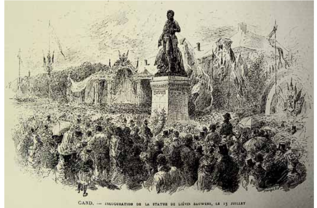
De inhuldiging van het standbeeld.

De feestcantate hechtte niet enkel aan Bauwens' heldendaden zelf belang, maar ook aan het voor de geest halen van die daden. Vlak voor het koor met Bauwens' levensverhaal van start ging, klonk deze introductie: 'Verbeelding, wijk! en laat ons in 't verleden zien, / Opdat wij aan een grooten man ons hulde biën.' Weg met de eigen hersenspinsels! Hogere machten werden aangespoord het koor te helpen het verhaal van Bauwens objectief voor de ogen van het publiek te brengen.