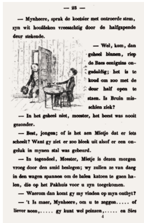
Sies Van Oost dient zich tijdens het ontbijt angstig aan bij Lieven Bauwens en vraagt hem de job van grootboekhouder. (uit: Jules DE SAINT GENOIS, De Grootboekhouder. Een Gentse vertelling, Gent: De Busscher, 1851, p. 25)

zich verlustigen aan het vertellen van deze en vele andere anekdotes uit het voorbeeldige leven van de textielabrikant, zo suggereerde hij. Daarenboven begon de Saint Genois zijn verhaal als volgt: 'Onder de voortreffelykste mannen, aen wie de hoofdstad van Vlaenderen het licht schonk, zyn er weinige, – hoewel hy noch borst-, noch standbeeld verkregen heeft, – die zoo veel burgerlyke verdiensten kunnen inroepen als de moedige fabrikant Lieven Bauwens.' 33 Het verhaal moest dus de voortreffelijkheid van Bauwens aantonen. Het deed dienst als een aanmoediging om zaak te maken van de oprichting van een beeld als een passende erkenning van de volksheld.