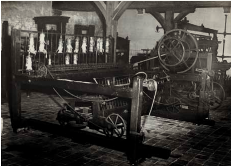
Lieven Bauwens smokkelde het weefgetouw de Mule Jenny naar Gent.

Op maandag 13 juli 1885 zong een duizendkoppig koor een cantate tijdens de inhuldiging van het standbeeld van Lieven Bauwens, op de kruising van de Vlaanderenstraat, Limburgstraat en Nederschelde in Gent. In het lied spoorde het koor het volk van Leie en Schelde aan om juichend toe te snellen. Iedereen moest namelijk zien hoe de stad haar heroïeke textielabrikant met roem overlaadde. Met de oprichting van een standbeeld vlocht Gent haar 'zoon een duurzame eerekroon', zo luidde het. 1 De lofzang maakte duidelijk hoe Bauwens geleden en gestreden had voor het heil van zijn volk. Hij was geen ijzervreter die afslachtte en bloed vergoot. Neen, deze held zocht brood en werk voor het volk. De zangers zongen hoe Bauwens de fiere Brit zijn grote geheim had weten te ontwringen. Met gevaar voor eigen leven bracht hij de Mule Jenny naar Gent, de meest uitgelezen machine om katoen te spinnen, om zo van de Scheldestad het Manchester van het continent te maken: