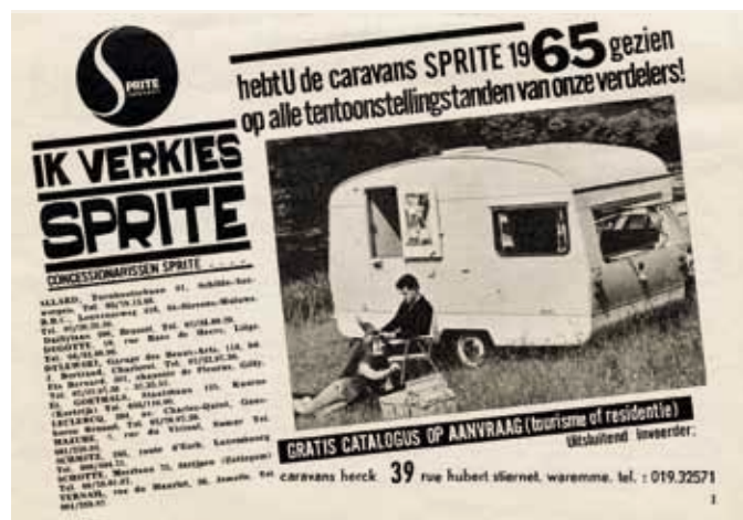
Publiciteit voor een caravan van het Britse merk Sprite uit 1965.

werden die moestuinen later op hun beurt omgevormd tot kampeerterrinen.