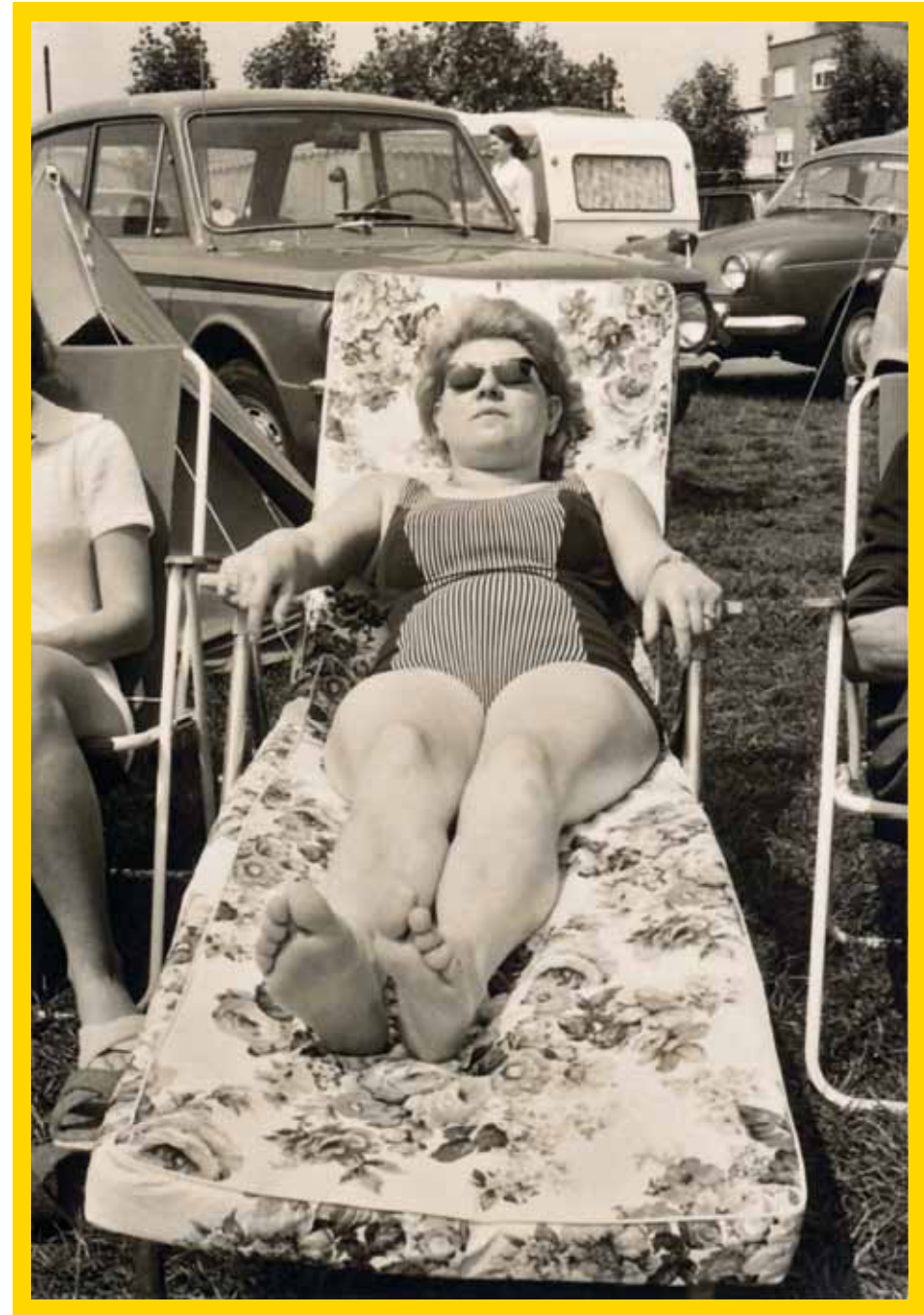
Languit luieren op de Bredense camping Metsu in 1968. (privécollectie Marc Constandt)

Vlakbij lag de Ferme Mariadyne van Arthur Claeys. Die werd in dezelfde periode een camping onder de auspiciën van de Camping Club de Belgique. Het waren dus twee boerderijen die het kamperen na de oogsttijd toelieten op hun veld. Vakantie op de boerderij avant la lettre.