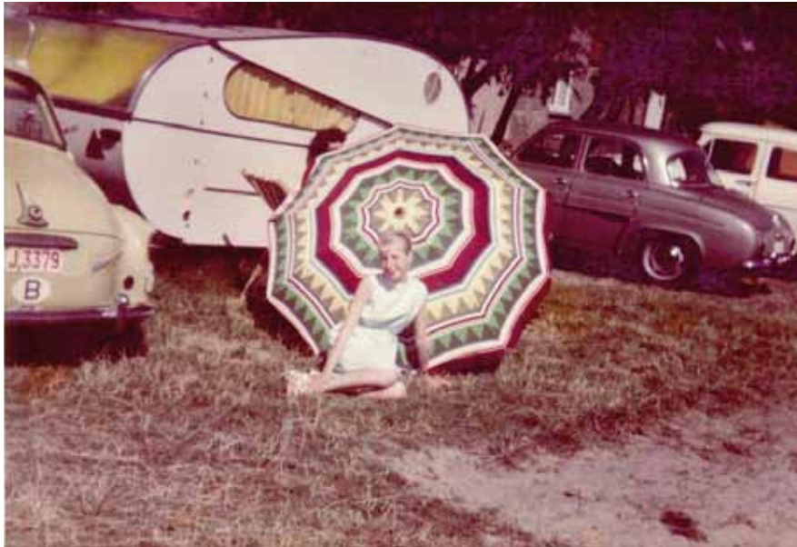
Sfeerbeeld van camping Achiel in Lombardsijde, 1959. Op de achtergrond een caravan van het Belgische merk WA-WA.

Het idee van de eigenlijke caravan wordt unaniem toegeschreven aan de Engelsen. Zelfs de voorzitter van de Auto Camping Club de France gaf dat in een Belgische uitgave in 1938 ruitelijk toe 15 : 'Les Anglais ont été nos maîtres. Ils l'ont adapté aux exigences modernes, leurs constructeurs ont été les initiateurs des nôtres.' De verspreiding van de caravan liet echter nog een tijd op zich wachten. Pas na de Tweede Wereldoorlog werd die gemeengoed.