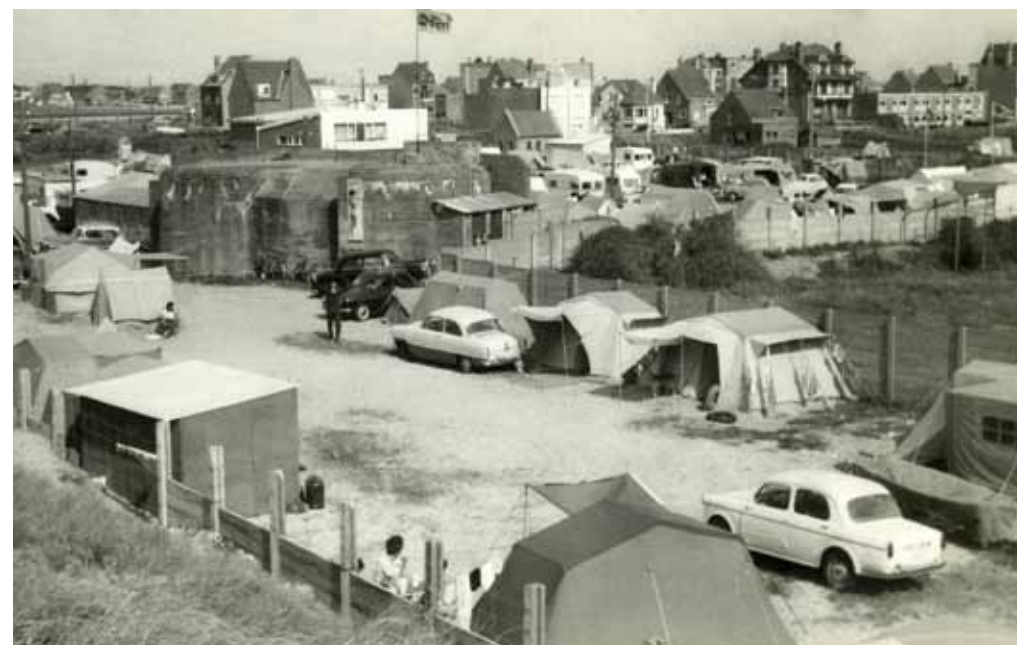
Camping Petit Bruxelles in Raversijde, toen nog een deelgemeente van Middelkerke, in de jaren 1960.