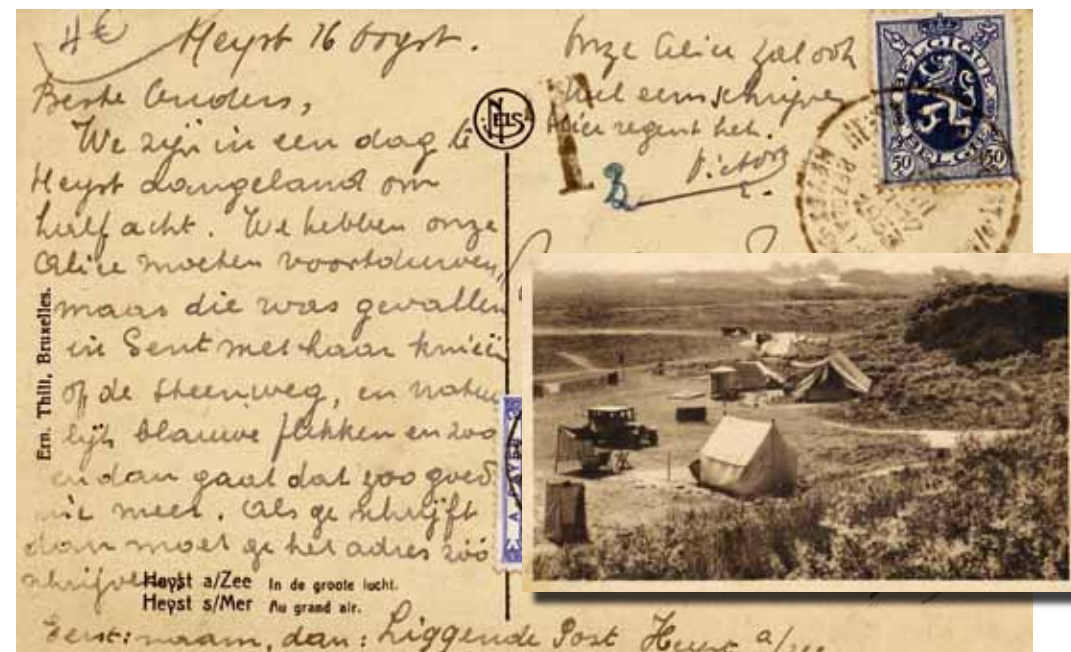
Wildkamperen in de duinen van Heist was omstreeks 1933 nog toegelaten.

fietzers daar gepakt en gezakt de natuur op. In 1906 opende de Engelse vereniging een eerste eigen kampeertrein. Holding publiceerde in 1908 in zijn thuisland een allereerste kampeergids, The Camper's Handbook . 1