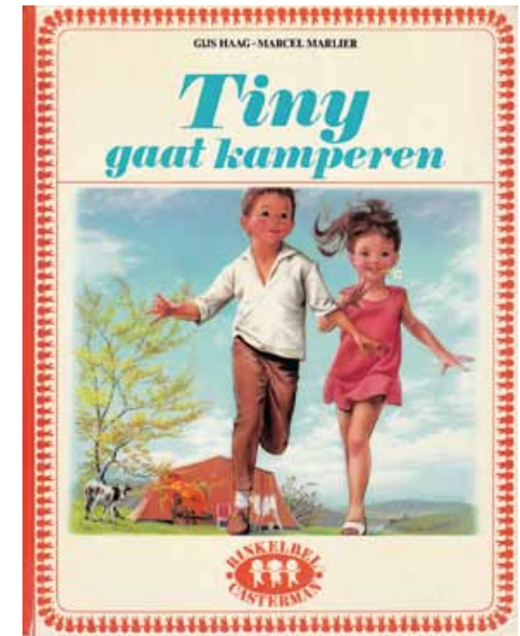
De kinderboekenreeks Tiny volgde nauwgezet de trends en toen kamperen een ingeburgerd gebruik was, mocht een verhaal erover niet ontbreken.

'Sinds enkele jaren verandert een fundamenteel feit het uitzicht van de campings: de residentiële caravaning. Vroeger kwam de kampeerder met zijn tent(je) en kon men spreken over 'zeildorpen'. Dit is nu veel minder waar. Op de campings zijn de caravans het talrijkst en, nieuw feit, een gedeelte van deze caravans – soms met de afmetingen van een echt huisje op wielen – blijft het hele jaar op het terrein.' 28