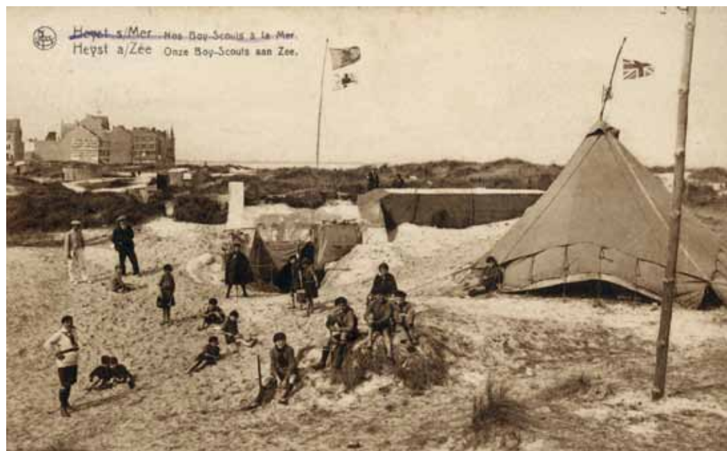
Prentbriefkaart van een kamp van de scoutsbeweging in Heist, verstuurd in 1926.