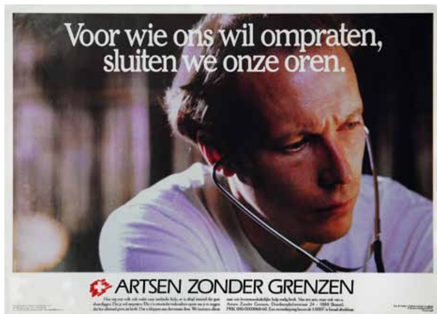
Affiche van Artsen Zonder Grenzen, jaren 1980.

We kunnen AZG inderdaad beschouwen als de vaandeldrager van een nieuwe generatie humanitaire organisaties (de 'sans-frontiéristes' ), maar dat wil niet zeggen dat het een onderdeel vormde van de tiersmondistische beweging. In de jaren 1980 klaagde AZG-B het optreden van de blanke man in het Zuiden – vroeger of vandaag – niet aan. Volgens de directeur van de organisatie lag 'het falen van alle theorieën die een betere toekomst beloofden via een mondiale planning – een bittere vaststelling –' aan de basis van het optreden van AZG. 33 AZG vond dat gerichte acties weer meer waardering moesten krijgen. Men kwam op voor de 'gezondheid', maar in een 'negatief' ideologisch kader: 'omdat men niet kan vechten voor het Goede, vecht men tegen het Kwade'. 34 Het werk op het terrein stond centraal bij AZG; dat was wat de artsen werkelijk bond. Over ideeën – welk soort organisatie moest AZG zijn – en personen werden er conflicten uitgevochten in de schoot van de organisatie, maar onmiddellijke en efficiënte medische hulp op het terrein was het belangrijkste. Op die manier slaagde AZG erin crises te overwinnen en de cohesie van de organisatie te bewaren; daarover zijn alle oudere leden die we interviewden het eens. Op die manier is AZG er op het einde van de jaren 1980 niet alleen in geslaagd om de gevaren van het taalseparatisme te bezweren, maar ook om een zware crisis te overleven. Dat gebeurde in verschillende fasen, die we nu meer in detail gaan uiteenzetten.