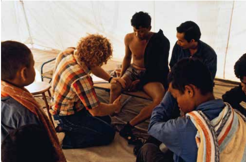
Thailand, 1978-1979.

toenemende mate samengewerkt met andere organisaties. Op het medische vlak waren dat vooral het Instituut voor Tropische Geneeskunde in Antwerpen en het Onderzoekscentrum voor Epidemiologie van de Universit  catholique de Louvain. Voor de niet-medische aspecten van de opleiding van haar leden werkte AZG-B samen met het Belgische leger, de rijkswacht en het opleidingscentrum Bioforce in Lyon. Op het terrein werkte AZG-B samen met haar zusterafdelingen uit Frankrijk, Zwitserland, Nederland, Spanje en Luxemburg, met Dokters van de Wereld, Caritas, Deutsche Notartze, maar ook met internationale organisaties zoals het Internationale Comit  van het Rode Kruis, het Hoog Commissariaat voor de Vluchtelingen van de Verenigde Naties en het United Nations Disaster Relief Organisation. 13