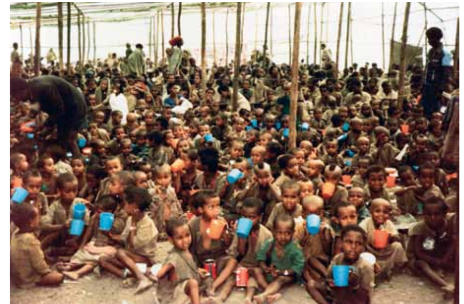
Groep kinderen in een voedingskamp in Korem, Ethiopië, 1985.