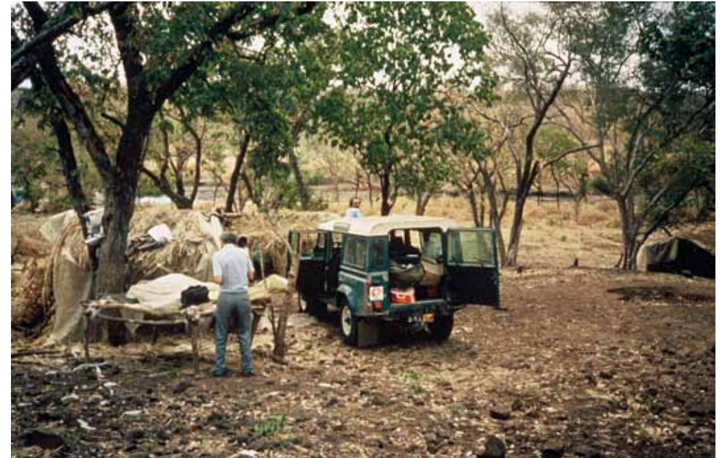
Bezoek van Artsen Zonder Grenzen aan een dorp in Tigray, 1985.

Dat originele standpunt was het resultaat van een levendige discussie die tot op de dag van vandaag actueel blijft in de wereld van de humanitaire hulpverlening. Die discussie laat zien hoe enorm moeilijk het voor ngo's van de vierde generatie is om in de eerste plaats hun geloof in de 'techniciteit' van hun opdracht uit te dragen. Dit is de eeuwige vraag: moet je een bepaalde situatie aanklagen, met het risico dat je niet meer kunt interveniëren; of moet je je mond houden om tussenbeide te kunnen komen, met het risico dat de situatie verder verslechtert? Een vraag die even eenvoudig als onoplosbaar lijkt. En er bestaat vanzelfsprekend geen pasklaar