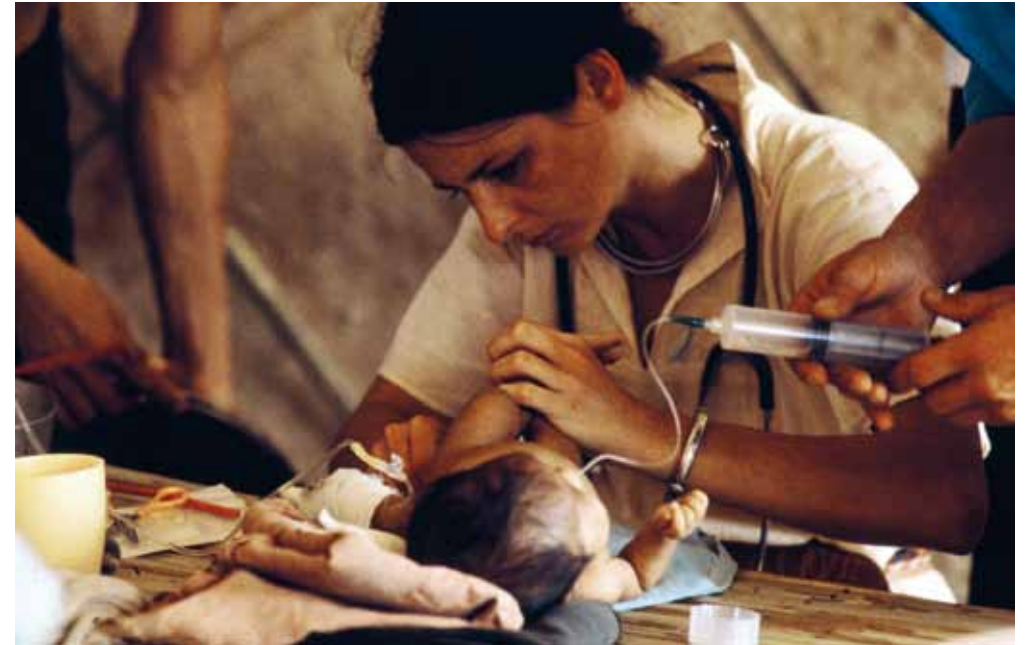
Thailand, 1978-1979.

In enkele jaren tijd kende AZG-B een ‘explosieve’ groei. In 1984 bedroeg het jaarbudget 175 miljoen Belgische frank. Drie jaar later was dat al opgelopen tot meer dan 488 miljoen. Tussen 1980 en 1987 was gemiddeld 65 procent daarvan afkomstig van de Commissie van de Europese Gemeenschappen – het percentage schommelde tussen 50 en 70 procent. Het aandeel van de particuliere giften steeg voortdurend, maar lag nooit hoger dan een kwart van de inkomsten voor de periode tot 1987. Voor de resterende financiering zorgden de Belgische en Nederlandse regering, de Verenigde Naties (Hoog Commissariaat voor de Vluchtelingen) en andere ngo’s en organisaties (zoals Rotary International, de Band Aid-concerten in 1984-1985 ...). Al in het midden van de jaren 1980 was het budget van AZG-B groter dan dat