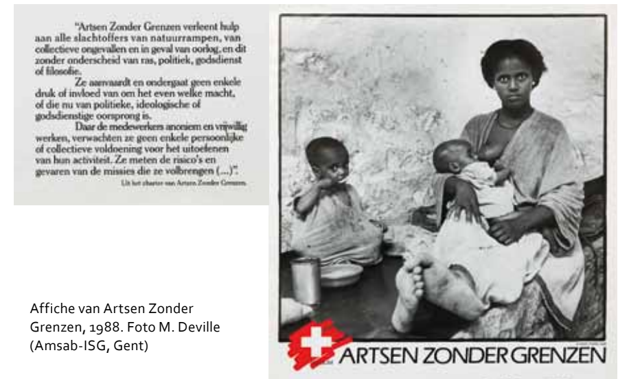
Affiche van Artsen Zonder Grenzen, 1988.

De LSF-crisis ontstond dus uit een ideeëndebat en ontaarde in een confrontatie tussen AZG-F en AZG-B, waarbij de leiding van die organisaties hun eigen mensen trachtte mee te krijgen. AZG-B en zijn baas Philippe Laurent koesterden een fundamenteel wantrouwen tegen AZG-F. Ze verdachten AZG-F ervan een grote neoliberale oorlogsmachine te willen scheppen, genre Heritage Foundation, maar dan naar