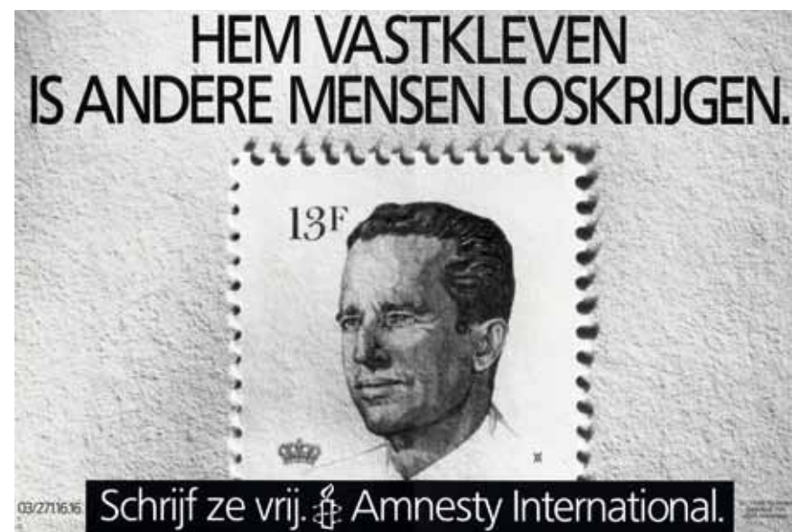
Affiche van Amnesty International Vlaanderen voor de Schrijf-ze-VRIJdag, 1989. (Amsab-ISG, Gent)

In die eerste jaren bleef de Nederlandstalige afdeling nog steeds sterk afhankelijk van de Nederlandse sectie. Ze probeerde om financieel sterker te staan. Dat lukte gedeeltelijk doordat de werking bleef groeien. Er kwamen meer en meer adoptie-