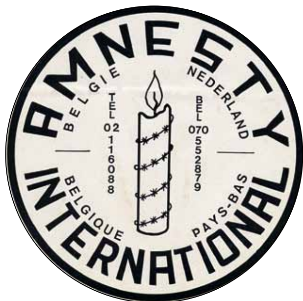
Sticker van Amnesty International België-Nederland.

Rond diezelfde tijd was er ook aan Franstalige kant interesse voor het werk van Amnesty International. De Franstaligen vonden eveneens onderdak bij de Liga voor de Verdediging van de Rechten van de Mens en konden gebruik maken van hun secretariaat. Het was via hen dat de secretaris-generaal van het Internationaal Secretariaat in Londen vroeg om een Belgische afdeling op te richten. Hoewel de samenwerking tussen de Nederlands- en Franstalige groepen niet altijd even vlot verliep, kwam daar in 1970 de eerste Belgische adoptiegroep uit voort. 5 In het begin bleef de Nederlandstalige groep sterk afhankelijk van de Nederlandse afdeling. Die stuurde alle post, infolders, documentatie- en ander materiaal door.