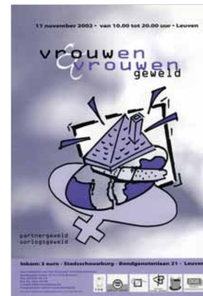
Affiches van de Vrouwendagen van 1997 en 2002.

en gelukkig? – een schokeffect teweegbrengen, gemodelleerd naar de provocatieve en ludieke acties van de vrouwenbeweging in de jaren 1970. Dat was mogelijk een poging om de vitaliteit en de onontbeerlijkheid van de Vrouwendagen aan te tonen. Het is opvallend dat de biologische geslachtstekens voor het eerst op gelijke hoogte staan, zonder het vrouwelijke teken centraal te stellen of het mannelijke teken in de rol van onderdrukker te casten. Dat kwam overeen met de tendens om op de Vrouwendagen mannen actiever de hand te reiken. Uit de evaluatie bleek echter dat de affiche opnieuw niet erg in de smaak viel. 29