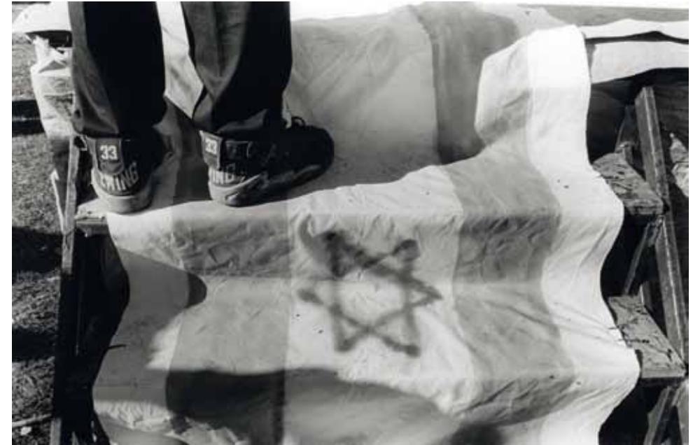
Tijdens een bijeenkomst van Hamas in Ramallah gebruiken militanten de Israëlische vlag als voetveeg, 1996.