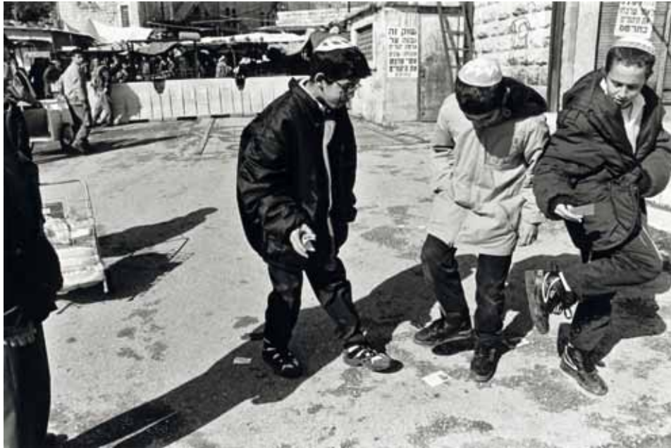
Joodse kolonisten in Hebron vegen hun voeten aan verkiezingspropaganda van de Palestijnen, 1996.

humanitair geïnspireerd en dient net als de UVRM als houvast voor Amnesty om respect voor mensenrechten af te dwingen, wat toen ook nodig bleek in de bezette gebieden.