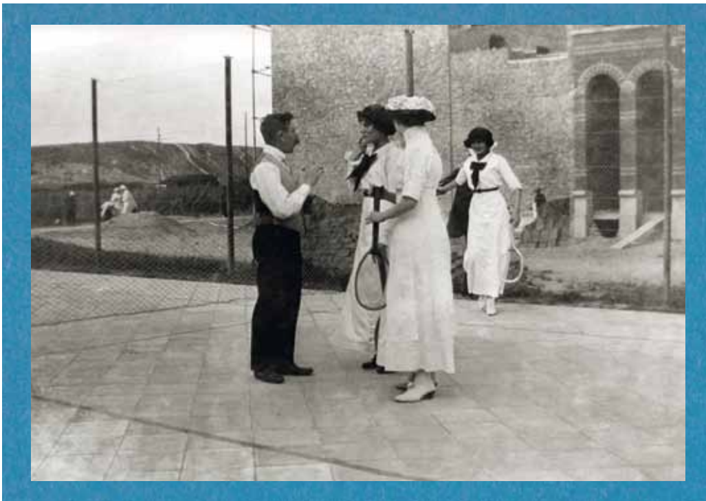
Tennisveld bij een van de eerste hotels van de badplaats Bredene voor de Eerste Wereldoorlog.

in het tijdschrift Mon Copain . Daardoor kreeg de verkiezing een mondain en licht erotisch tintje. Daarmee was de toon gezet. Toen na de Tweede Wereldoorlog overal missen werden verkozen, werden die steeds voorgesteld in badpak.