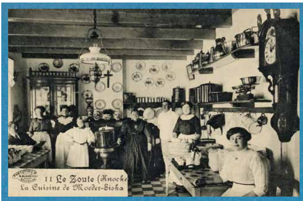
De keuken van de horecazaak Moeder Siska in Knokke-Het Zoute voor de Eerste Wereldoorlog. De imposante uitbaatster staat naast de Leuvense stoof, omringd door haar overwegend vrouwelijk personeel. (collectie M. Constandt-Bloes)

Frank kreeg. De andere vrouwen werden heel wat minder betaald. De werknemers woonden waarschijnlijk allemaal in. Ze kwamen uit de onmiddellijke buurt van Westende, Lombardsijde en Nieuwpoort of uit de omgeving van Brussel. De eerste thuisadressen lagen in Jumet, Doornik en Thulin. De badplaats Westende had een lange traditie van Italiaans hotelpersoneel, maar in tegenstelling tot hun mannelijke collega's kwam niemand van de vrouwen uit het buitenland.