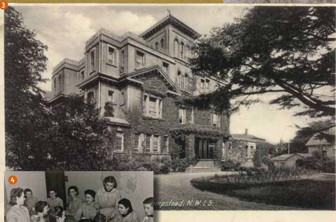
3. Het klooster van Our Lady of the Cenacle in Hampstead.