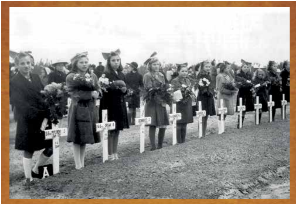
Herdenkingsplechtigheden op de militaire begraafplaats in Lommel, eind jaren 1960 (links) en jaren 1980 (rechts).

België, opgericht in 1945 (Centralna Rada Narodowa). Die mensen kenden de Poolse Volksrepubliek al en hadden een verwaarloosbare invloed op het organisatieleven van Poolse migranten in België. 54