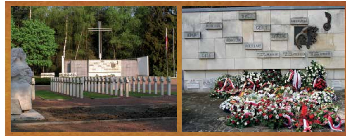
Op de Poolse militaire begraafplaats van Lommel staat een monument dat de Poolse regering grotendeels financierde en dat met een vrachtwagen naar België werd gebracht.

Die naturalisatiedossiers ontsloten ook dat gewezen divisiesoldaten in contact waren gekomen met een Belgische organisatie die gewezen verzetsstrijders groepeerde. In 1957 zond het Belgisch Patriottisch Comité van de stad Sint-Niklaas op vraag van het Sint-Niklase stadsbestuur een groepsaanvraag tot naturalisatie in voor twintig gewezen divisiesoldaten. 74 Die groepsaanvraag had tot gevolg dat de