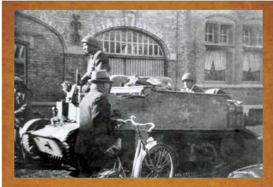
Bevrijding van Ruiselede door de Eerste Poolse Pantserdivisie op 8 september 1944.