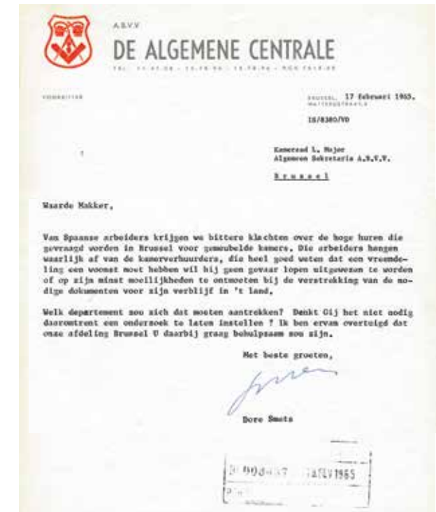
Brief uit 1965 van de voorzitter van de Algemene Centrale aan de algemeen secretaris van het ABVV met een klacht over de te hoge huren die aan Spaanse gastarbeiders in Brussel werden gevraagd.