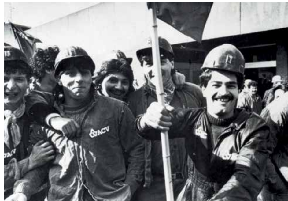
Betogende mijnwerkers van het ACV in Limburg, jaren 1980.

Het ACV/CSC bouwde in de volgende decennia de omkadering van vreemde arbeidskrachten verder uit. De Nationale Dienst der Vreemde Arbeiders, belast met de propaganda voor en de rekrutering van vreemde arbeiders, werd een meer solide