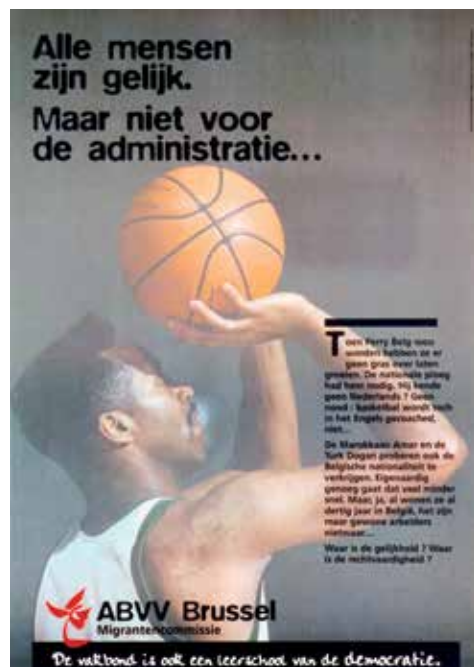
Affiche van de ABVV-migrantencommissie uit 1997.