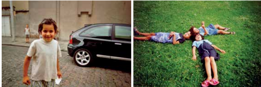
Foto's van het project Ik woon in een monument in Deurne, waarbij zo veel mogelijk buurtbewoners werden betrokken. Foto's Timothy Verberck, Joyce Wong, Mannassee Maswama, Fais El Fadili. (Amsab-ISG, Antwerpen)

kwamen op de diverse tentoonstellingsplaatsen materiaal aanbieden. De ervaring was leerrijk: binnen de Turkse gemeenschap bestond wel degelijk belangstelling voor de eigen geschiedenis, er was ook erfgoed aanwezig, maar om dat op te sporen en te bewaren, moest nog een tandje bijgestoken worden. Bij de tentoonstelling was maar één Turkse vereniging betrokken; in de aanloop naar de herdenking van 50 jaar Turkse aanwezigheid in Gent in 2014 zijn er dat al een pak meer.