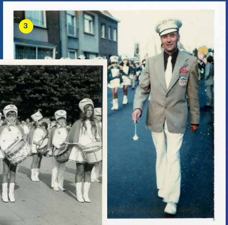
1. Majorettes van Fantasiekorps Crescendo uit Brasschaat in 1969.