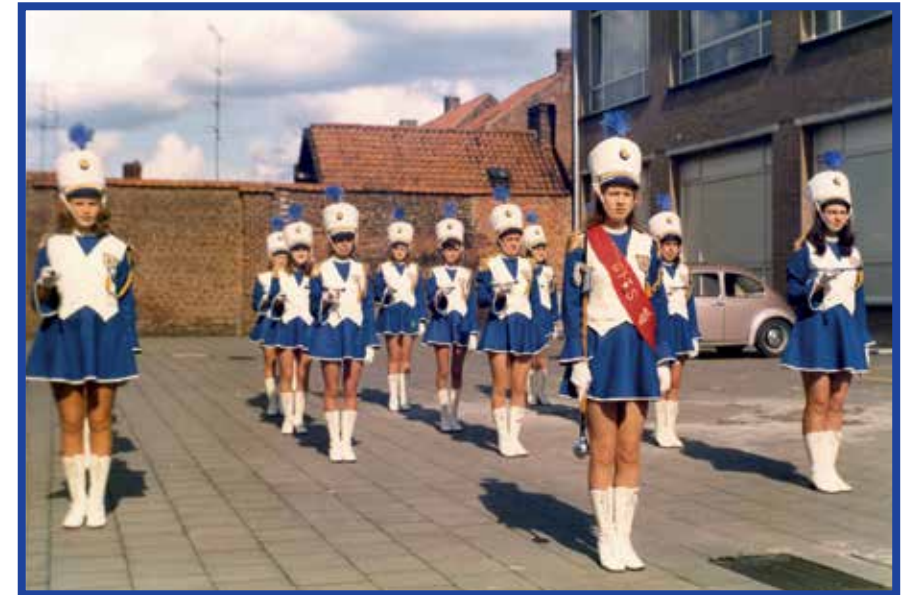
Majorettes van Harmonie Deugd en Vreugd uit Gits tijdens een parade in Izegem, 1972.

Een majorette met een slordig kapsel en onverzorgde kledij hoorde niet. Voordat een majorette vertrok, werd het stokje opgeblonken en werden de handschoenen en het rokje witgewassen. Met speldjes en haarlak bracht moeder het kapsel in model. Een beetje make-up maakte de verschijning compleet. Tijdens de uitstap hielden