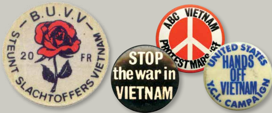
Sticker en badges voor solidariteit met Vietnam.