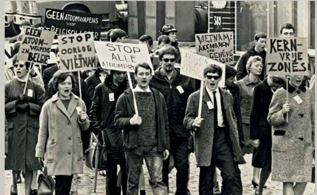
Antiatoommars in Brussel met slogans tegen de oorlog in Vietnam, midden jaren 1960.

De Wereldvredeesraad en het Bevrijdingsfront moedigden die internationale aanpak sterk aan, onder meer via hun tijdschriften, zoals Perspectives en de wijdverspreide Le Courrier du Vietnam – een van de belangrijkste informatiekanalen