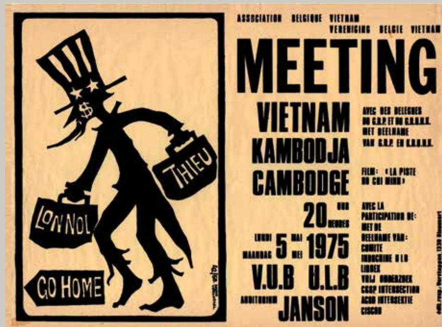
Affiche uit 1975 van de Vereniging België-Vietnam voor solidariteit met Vietnam en Cambodja. Ontwerp: Jo Dustin en Georges Vercheval (Amsab-ISG, Gent)