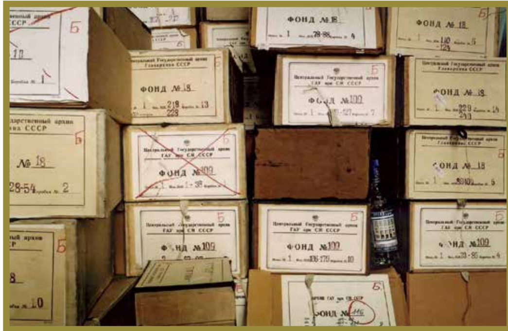
Archieven van Belgische personen en organisaties (waaronder Joodse), geroofd door de nazi's, vervolgens aangeslagen door de Sovjets en in 2002 teruggeschonken aan België.

dan ook niet verwonderlijk dat verenigingsarchieven vaak geschonken worden aan archiefdiensten die politiek of cultureel 'verwant' zijn – Amsab-ISG, KADOC-KU Leuven, Liberaal Archief, ADVN, Dacob/CARCoB ... maar ook het Joods Museum van België en MANAVZW. 33