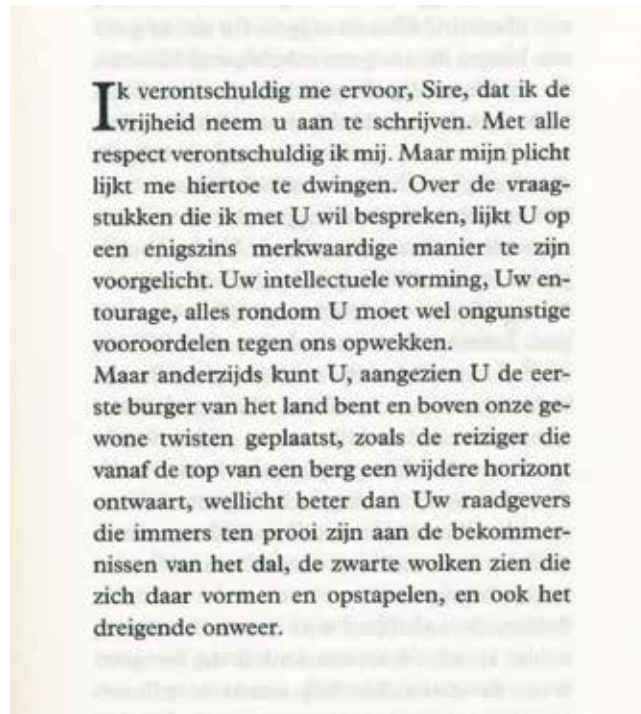
Fragment uit de brief die Destrée tot de koning richtte. (uit: 'Ils nous ont pris la Flandre'. Waals socialisme en Belgische illusies. Van Jules Destrée tot Elio Di Rupo )