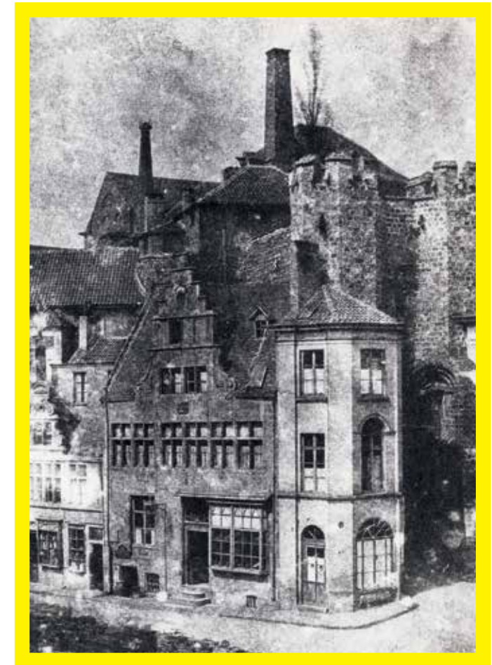
Het Gravensteen in Gent rond 1847, ingenomen door fabrieken. Tegen de walmuur staan woningen aangebouwd.

De industrie vond de nodige arbeidskrachten onder de bedelaars, werklozen, kinderen en ontheemde plattelandsbewoners, gevlucht door de arsenaalversnippering in de landbouw en de crisis in de huisnijverheid. Ook de 1500 'misdadigers' uit het correctiehuis Rasphuis aan de Coupure, werden in ruil voor onderhoud als dwangarbeiders ingezet, onder andere bij Lieven Bauwens. In 1810 telde de katoenindustrie bijna 11.000 arbeiders en in 1846 werkte 70 procent ervan in de textiel. De arbeidsomstandigheden waren erbarmelijk: geen sociale wetgeving of arbeidsreglementering, een 6 dagenweek van 12 tot 14 uren per dag in ongezonde, vochtige en lawaaijige fabrieken aan een hels tempo tegen een hongerloon. Kinderarbeid was courant én nodig om het gezinsinkomen wat aan te vullen. 70 procent van het inkomen ging naar voeding en amper 10 procent naar huisvesting. Maar door de hoge voedselprijzen en een landbouwcrisis lag honger steeds op de loer, zoals bij de hongersnood in 1840, de voedselrellen in 1847 en het aardappeloproer in 1855. Die