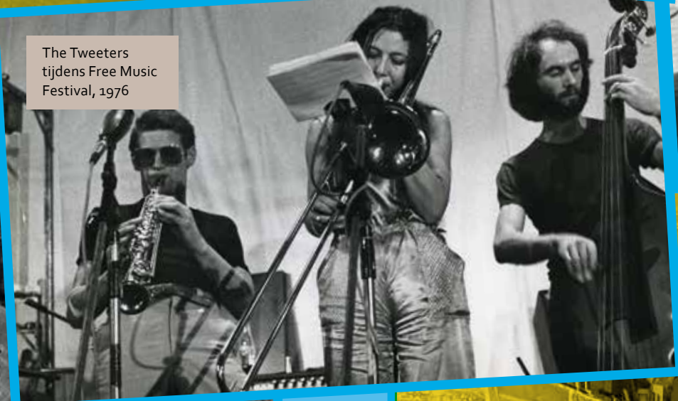
The Tweepers tijdens Free Music Festival, 1976