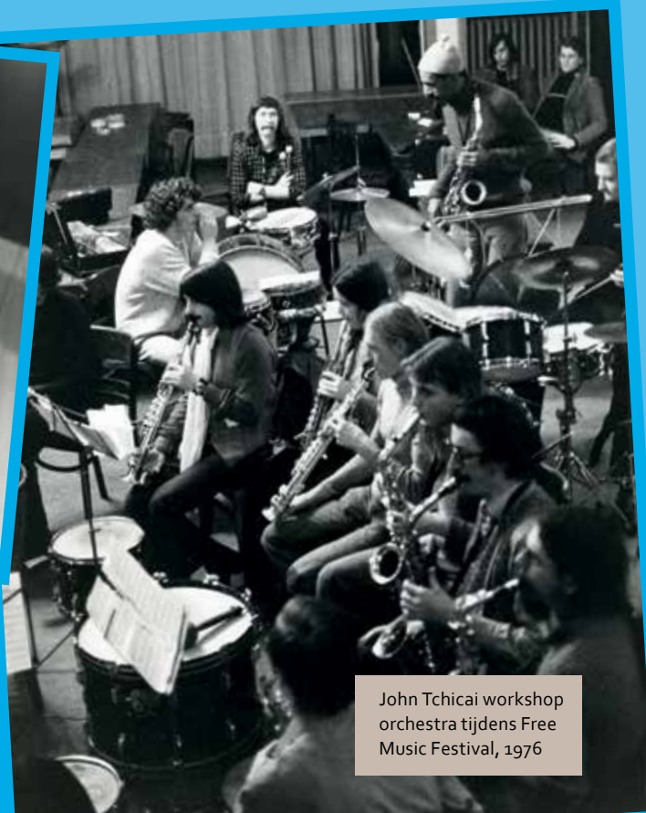
John Tchicai workshop orchestra tijdens Free Music Festival, 1976