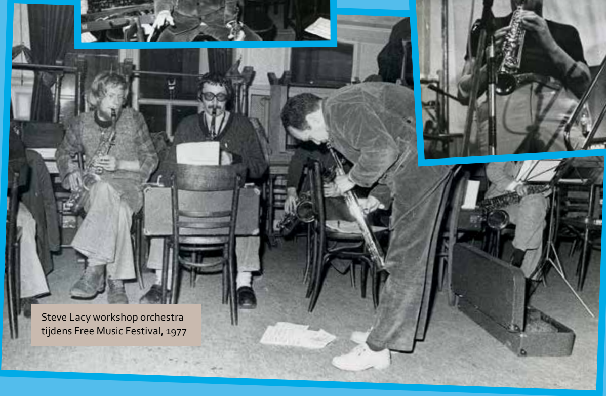
Steve Lacy workshop orchestra tijdens Free Music Festival, 1977