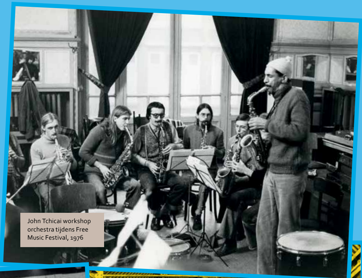
John Tchicai workshop orchestra tijdens Free Music Festival, 1976