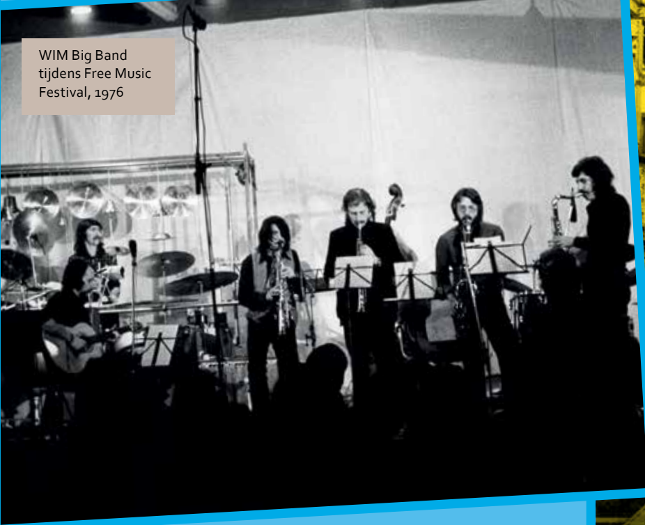
WIM Big Band tijdens Free Music Festival, 1976