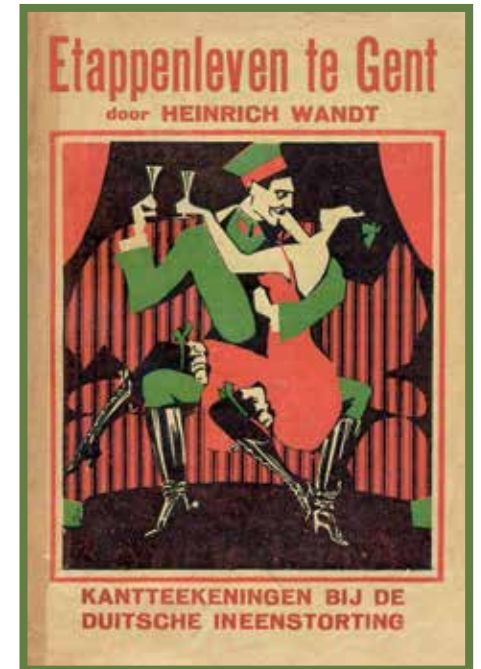
Cover van de eerste Nederlandstalige uitgave, 1921. (Amsab-ISG, Gent)

◀ Heinrich Wandt in veldtenue in het Gentse Citadelpark, 1915. (Amsab-ISG, Gent)