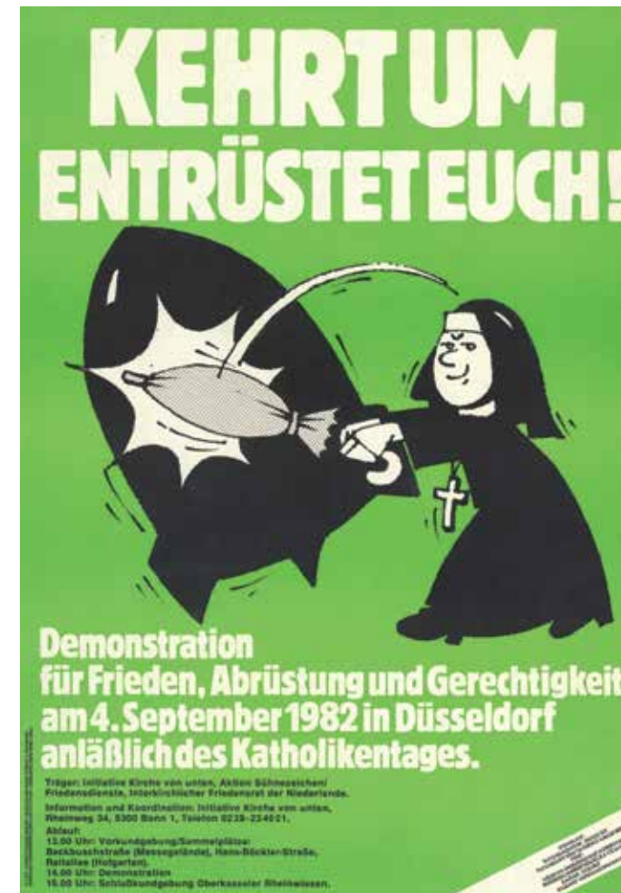
Affiche voor een vredesbetoging in het West-Duitse Düsseldorf, georganiseerd door het IKV in samenwerking met het Serviceteam (Keulen), de Initiative Kirche von Unten (Bonn) en de Aktion Sühnezeichen/Friedensdienste (Berlijn).

Het scepticisme tegenover het onderhandelingsproces in Genève werd alleen maar groter toen de situatie in Oost-Europa aanzienlijk verslechterde. De opkomst van verschillende democratiseringsbewegingen in de Sovjet-Unie en haar satellietstaten kon rekenen op een keiharde reactie van de regimes in kwestie. De Poolse vakbond Solidarność werd in december 1981 zelfs compleet verboden. Voor het IKV was het duidelijk dat een kernwapenvrij Europa nog geen garantie op vrede was. Alleen met een zogenaamde ontspanning van onderop kon een einde komen aan de militaire blokken