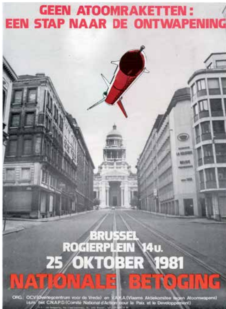
Affiche voor de betoging van 25 oktober 1981, georganiseerd door het ocv en VAKA. (Amsab-ISG, Gent)

oktober vormden de Europese hoofdsteden het decor van het antikernwapenprotest. De demonstratie in Brussel trok maar liefst 200.000 mensen, die in Amsterdam kon zelfs op het dubbele aantal deelnemers rekenen. Het politieke effect bleef opnieuw gering. Tot een wijziging in het defensiebeleid van Nederland en België kwam het niet. Wel gingen eind november de onderhandelingen tussen de Verenigde Staten en de Sovjet-Unie in Genève eindelijk van start, maar die golden volgens Faber slechts als een propagandaopvoering waarmee de grootmachten de publieke opinie voor zich wilden winnen. 23