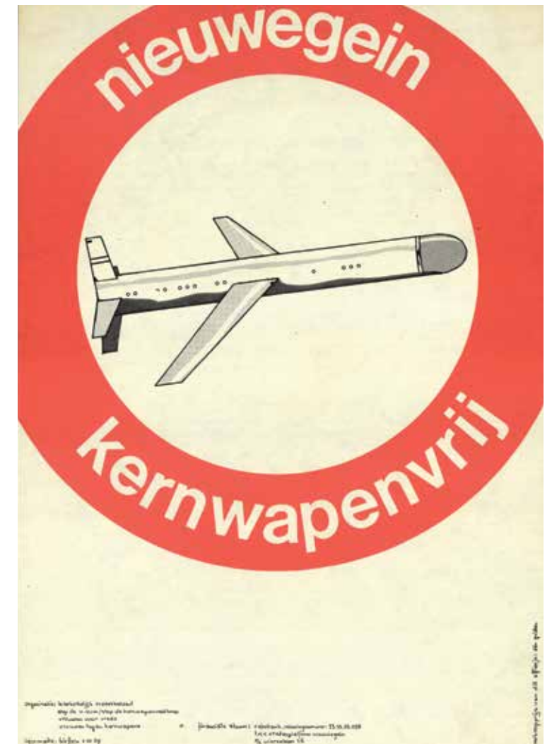
Affiche in het kader van de campagne voor kernwapenvrije gemeentes, hier voor het Nederlandse Nieuwegein.

Ondanks de verdeeldheid over de ontspanningspolitiek droeg de internationalisering ook bij aan een zekere toenadering tussen de verschillende nationale campagnes. Op uitnodiging van het IKV kwamen de West-Europese vredesbewegingen begin maart 1982 bijeen in kasteel Oud-Poelgeest om