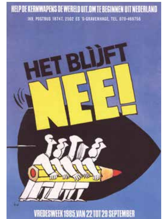
Affiche van het IKV voor de Vredesweek in 1985.