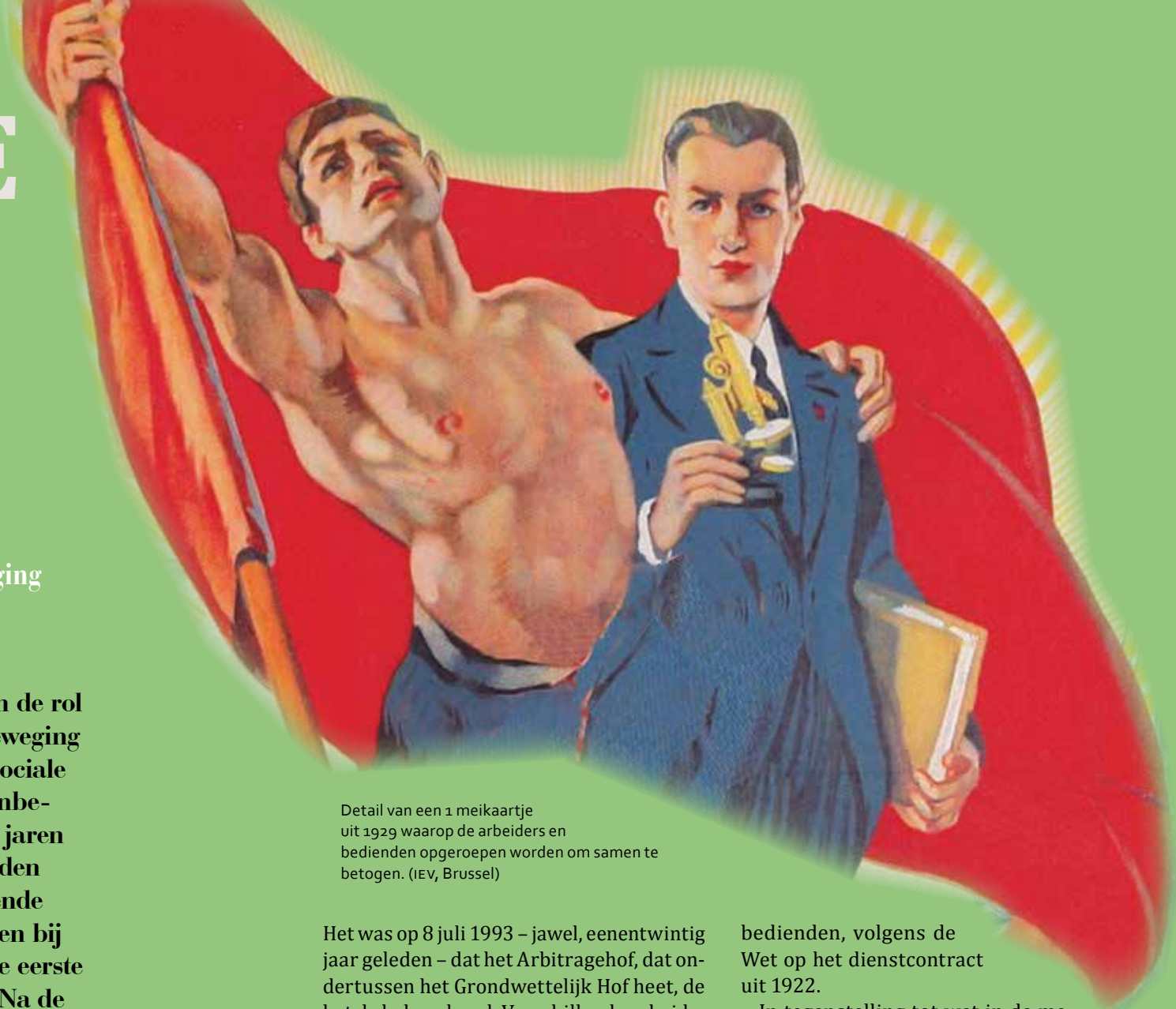
Detail van een 1 meikaartje uit 1929 waarop de arbeiders en bedienden opgeroepen worden om samen te betogen.

groep van de bedienden en de rol die hun georganiseerde beweging daarbij speelde. De hoge sociale status en het sterke klassenbewustzijn die tot diep in de jaren 1920 overeind bleven, leidden tot een duidelijk verschillende behandeling voor bedienden bij het tot stand komen van de eerste beschermende wetgeving. Na de malaise van het bediendevraagstuk kalfde de status in ijltempo af. De houding van de grote organisaties werd weliswaar beïnvloed door hun verschillende ideologische achtergrond, maar evolueerde mettertijd in een min of meer gelijklopende richting.