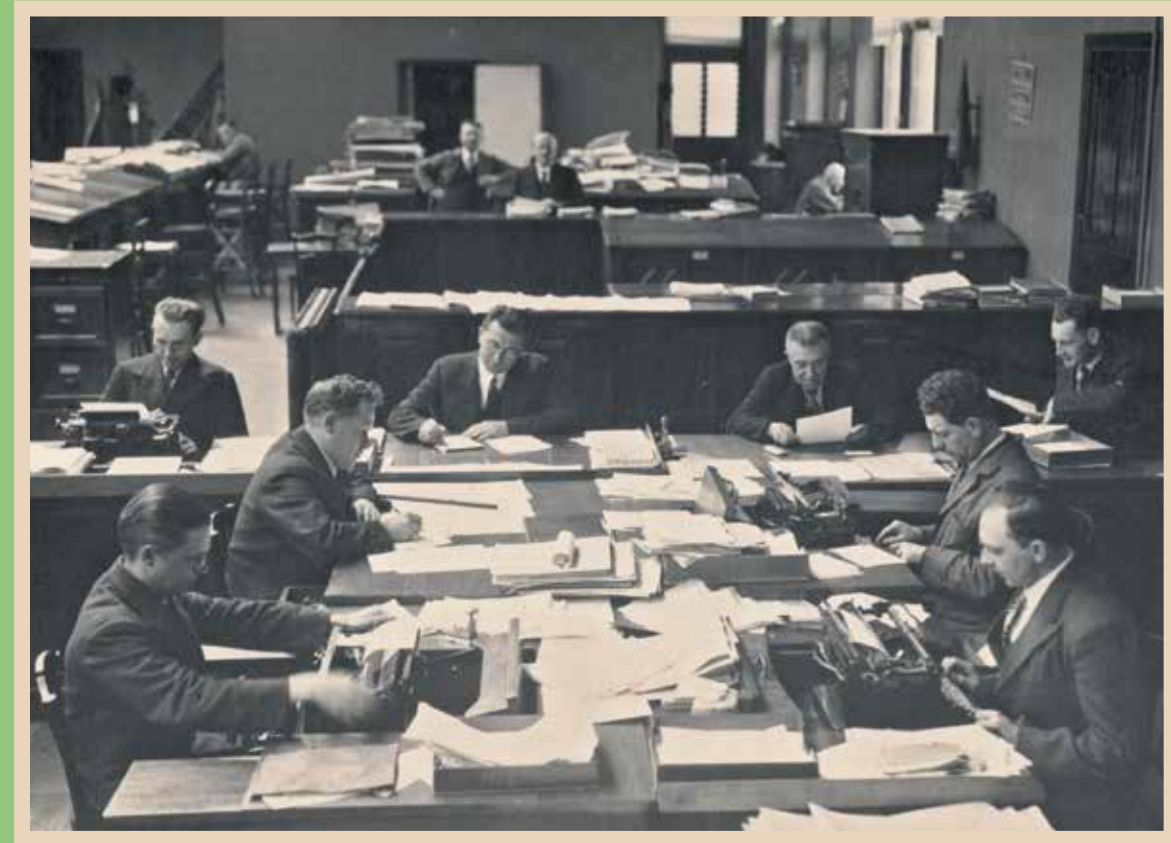
Bedienden aan het werk, jaren 1930.

Wat sommige waarnemers gevreesd of gehoopt hadden, namelijk dat door dit dossier een tweespalt veroorzaakt zou worden binnen de werknemersbeweging tussen arbeiders en bedienden, is niet gebeurd.