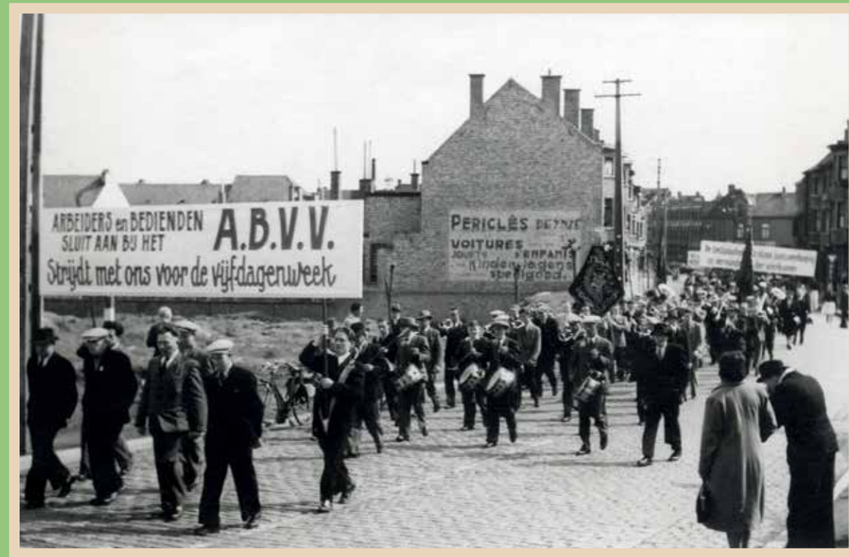
Oproep van het ABVV aan de arbeiders en bedienden om samen te strijden voor de vijfdagenweek, tijdens de 1 mei optocht van 1950 in Deinze.

Onvermijdelijk had dat gevolgen, onder meer op ideologisch vlak. De ‘standsorganisatie’ voor bedienden, als uitdrukking van hun belangenverdediging op alle ter-