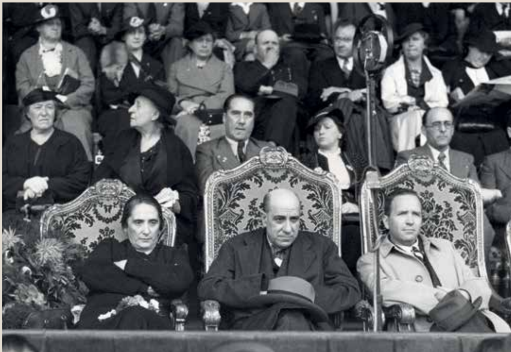
Dolores Ibárruri of La Pasionaria op de slotmeeting van het Wereldvredescongres in het Heizelstadion in Brussel op 6 september 1936.