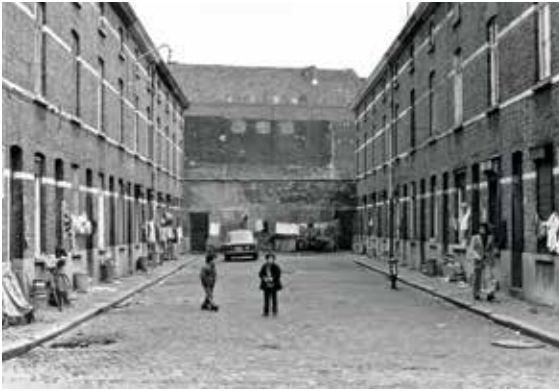
Rode Lijvekensstraat.