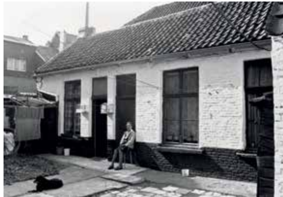
Goudensterstraat.