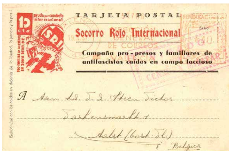
Briefkaart van de Socorro Rojo Internacional als steun voor de gevangenen en de familie van de gesneuvelden in de strijd tegen het fascisme.

Dat de republikeinse troepen standhouden in Madrid, heeft vooral te maken met de Sovjet-Russische militaire steun die vanaf midden oktober op gang komt. Voor het Internationaal Solidariteitsfonds leidt dat echter tot nieuwe problemen. Enerzijds