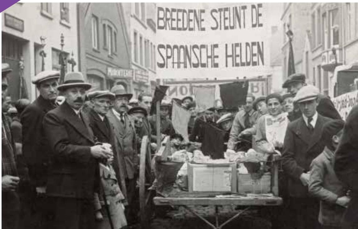
Optocht in Bredene uit solidariteit met de Spaanse republikeinen tijdens de burgeroorlog in Spanje, eind jaren 1930.

overtuigen om meer te doen voor het Frente Popular. Max Buset windt er geen doekjes om op het Bureau van de BWP van 5 februari 1937 en verwijt de beweging er in haar campagne van uit te gaan 'dat Franco zal zegevieren'. En hij gaat verder zonder zich veel aan te trekken van hen die protesteren: 'Ik ben bang dat de Tweede Internationale de geest zal geven in Spanje. Iemand moet absoluut door de Internationales worden belast met de organisatie van de internationale brigade in Madrid. Het barst daar van de communisten, maar er bevinden zich ook veel leden van de BWP [...]. We kunnen deze zaak pas regelen wanneer we in dat land een huis [van de Internationale] en een commissaris hebben [...]. Als we onze mensen daar niet willen verliezen, dan moeten we een en ander organiseren.' 19 Kortom, de Socialistische Arbeidersinternationale mist in