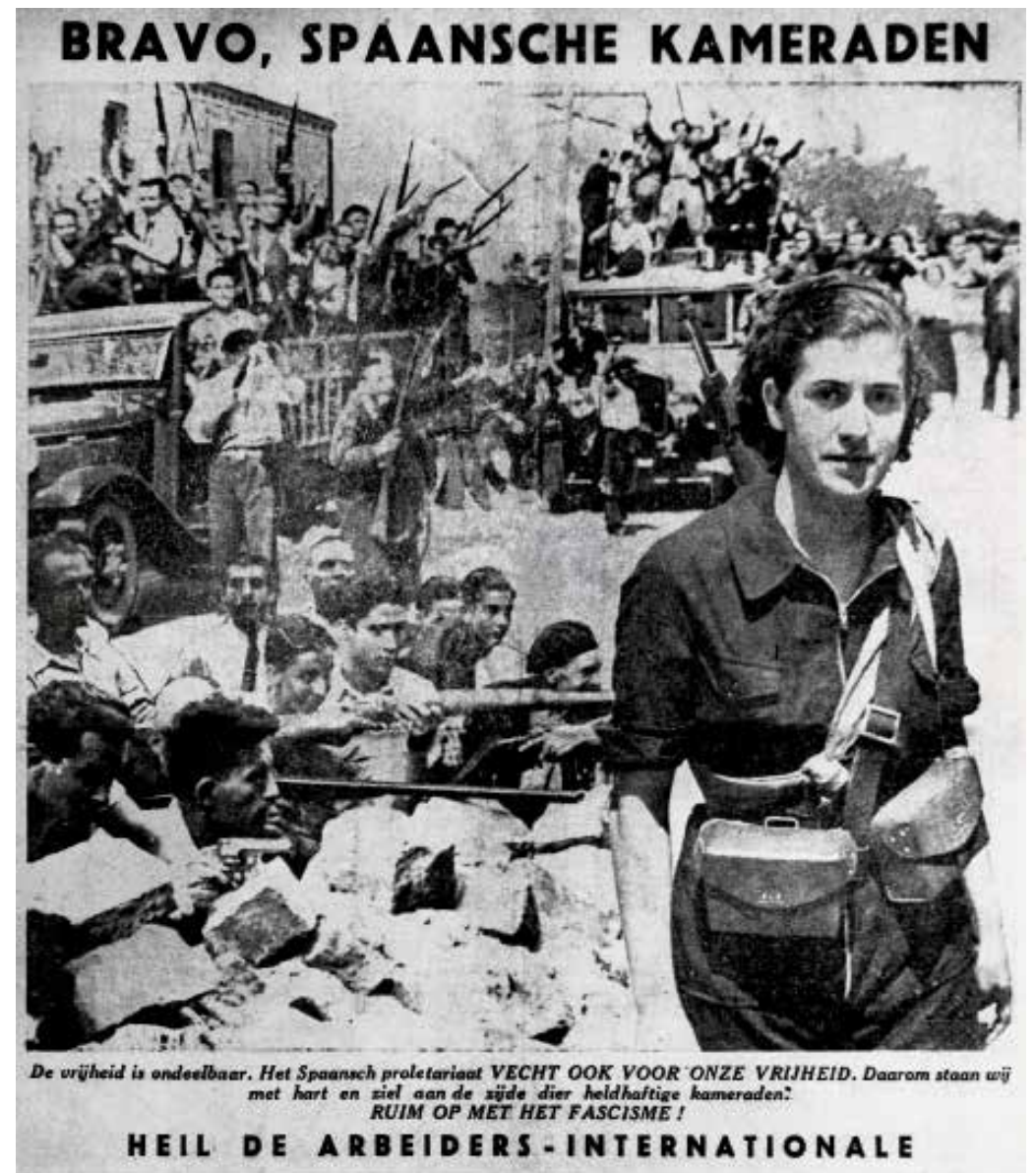
Een collage tegen het fascisme, uit het socialistisch weekblad Voor Allen , jaren 1930.

De hulpgoederen van het Internationaal Solidariteitsfonds stromen intussen toe en worden dankbaar in ontvangst genomen, maar de wapenleveringen zijn een ander paar mouwen. Hoewel Léon Blum op 25 juli nog had opgeroepen om alleen materiële steun te verlenen, knijpt zijn regering toch een oogje dicht en gaan de wapenleveringen aan de republiek onverminderd door. Dat verandert begin augustus echter, want dan ziet de Franse regering zich verplicht om de grens met Spanje te sluiten, en wel onder druk van de Britse ambassadeur en na dreigementen van de Duitse en de Italiaanse ambassadeurs. 5 De leider van het Franse Volksfront biedt op 6 augustus de fascistische mogendheden een beleid van non-interventie aan in de hoop hen op die