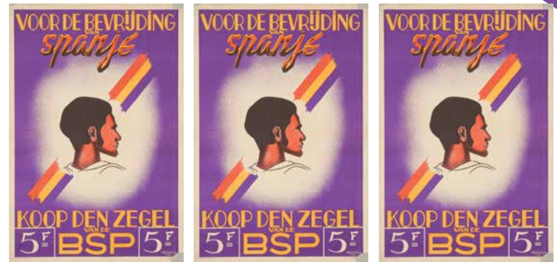
Prentbriefkaart van de BSP met een oproep om de Spaanse republiek te steunen. Ontwerp: Michel Meerts (Amsab-ISG, Gent)

Hoewel de Belgische Werkliedenpartij, de Socialistische Internationale en de Internationale Vakbondsfederatie een omvangrijke solidariteitscampagne met het republikeinse Spanje op het getouw hebben gezet, heeft die tot dusver niet de aandacht gekregen die zij verdient. Dat heeft te maken met het beleid van non-interventie, het gebrek aan middelen en de neiging van de socialistische leiders om in de schaduw te werken en zich niet nadrukkelijk te profileren. Nochtans hebben ook Belgische socialistische militanten waardevolle initiatieven ontplooid nadat de militaire steun van de Sovjet-Unie een feit werd, al botsten die meestal met het officiële non-interventiebeleid van hun organisaties en de wens om het socialistische karakter van die initiatieven niet verloren te laten gaan. In de winter van 1937 werd dan toch een compromis bereikt. Dat beoogde de aanstelling van een permanente vertegenwoordiger, de oprichting van een bureau van de Internationales in Spanje, een groter aantal commissarissen bij de Internationale Brigades en de creatie van een ultramodern militair hospitaal. Door de hoge kosten en het constante politiek gekibbel slorpte dat hospitaal uiteindelijk alle middelen op.