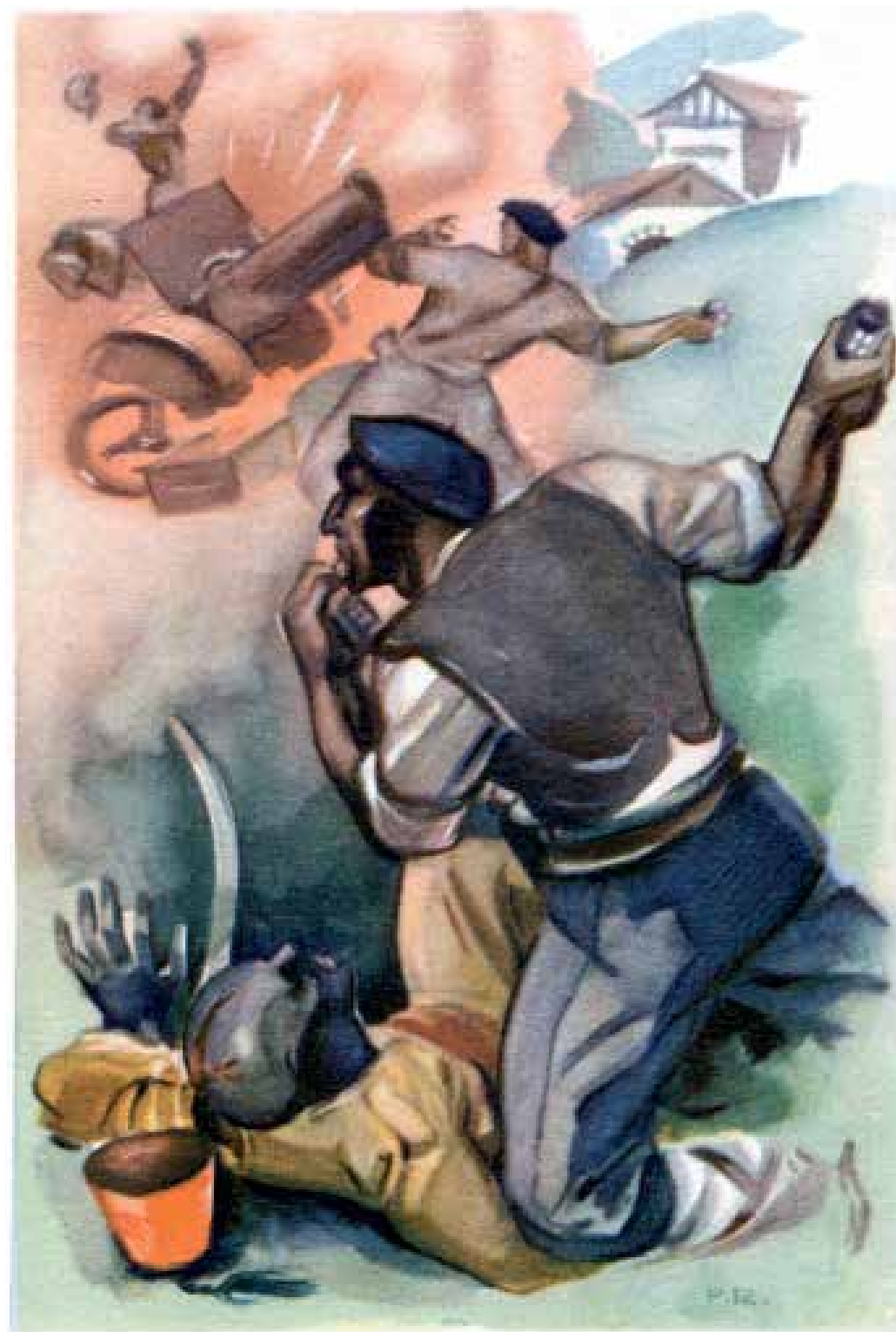
Prentbriefkaart met een scène uit de Spaanse Burgeroorlog.