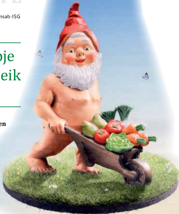
Detail uit een affiche van Velt voor de campagne 'Durf tuinieren zonder' uit 2009. Ontwerp: Wouter Pardaens (Amsab-ISG, Gent)

Vzw Velt werd officieel opgericht op 20 januari 1974, maar de wortels van de vereniging gaan dieper terug in het verleden. De eerste zaadjes