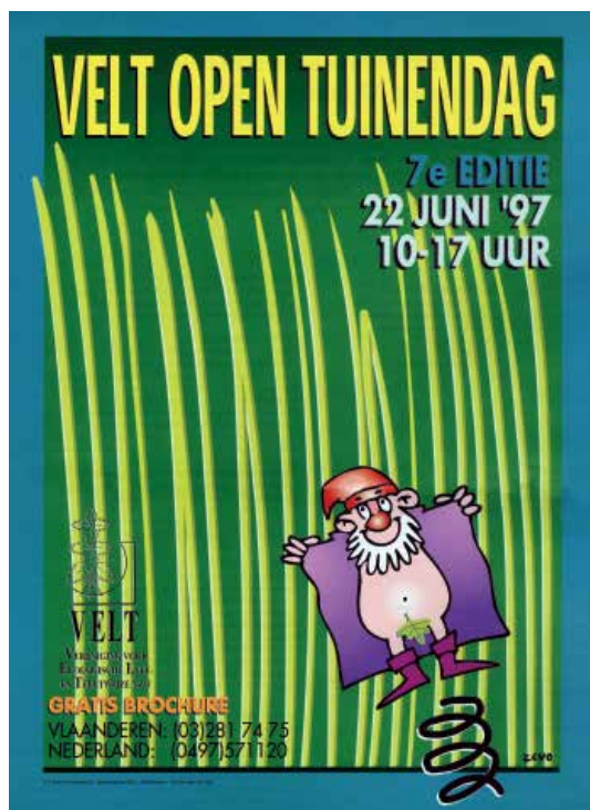
Affiche van Velt voor de zevende Opentuinendag in 1997. Ontwerp: Jan Van Craesbeeck (Zeno) (Amsab-ISG, Gent)

De conclusies van de werkgroepen op het congres van 24 en 25 januari 1981 waren duidelijk: Velt moest eerst en vooral zijn vele leden ondersteunen. Het landelijk secretariaat moest informatie verzamelen en doorgeven, lesgevers opleiden en activiteiten van de plaatselijke afdelingen faciliteren. 't Seizoentje moest grondig uitgebouwd worden en vooral relatief gemakkelijke artikels bevatten. Moeilijkere of meer technische aspecten van de biologische land- en tuinbouw moesten aan bod komen in specifieke publicaties. De aandacht moest verder gaan dan louter de teeltwijze. Ook gezonde voeding, koken, alternatieve leef- en geneeswijzen, kruidenteelt ... hoorden aan bod te komen. Met die visie koos Velt er duidelijk voor om een gesubsidieerde vereniging voor sociaal-cultureel vormingswerk te worden. De leden vonden wel dat de band met de beroepstellers niet uit het oog verloren mocht worden. Bovendien werd er nog vastgehouden aan het Velt-label. 12