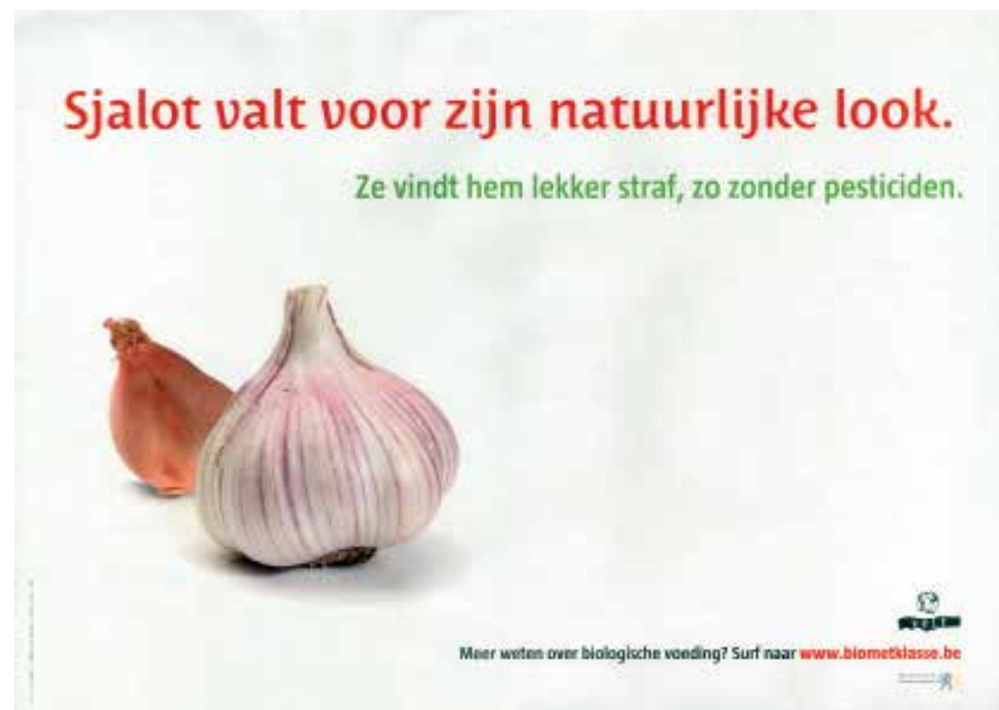
Affiche van Velt voor een campagne over biologische voeding in 2010.

Over de afzet van biologische producten waren de meningen binnen Velt verdeeld. De meeste telers waren er zeer voor te vinden om een bedrijf op te richten dat de producten zou verkopen die gekweekt waren volgens de strenge eisen van het lastenboek. De andere leden waren echter niet zo happig om met commerciële activiteiten te beginnen. In oktober 1976 werd er enigszins schoorvoetend beslist om een samenwerkende vennootschap op te richten, maar enkel op voorwaarde dat er genoeg kandidaten en kapitaal waren en dat het geen zuiver commerciële bedoening werd. De winsten moesten in het bedrijf geïnvesteerd worden of in andere initiatieven van Velt. Op 27 februari 1977 werd de samenwerkende vennootschap Veltco gesticht. 8 Die hield het echter niet lang vol: al in de loop van datzelfde jaar kwam Veltco in slechte financiële papieren. Op 30 september 1978 werd de vennootschap opgedoekt en gingen de restanten op in de nv Veldboerke. 9 De teloorgang van Veltco was een