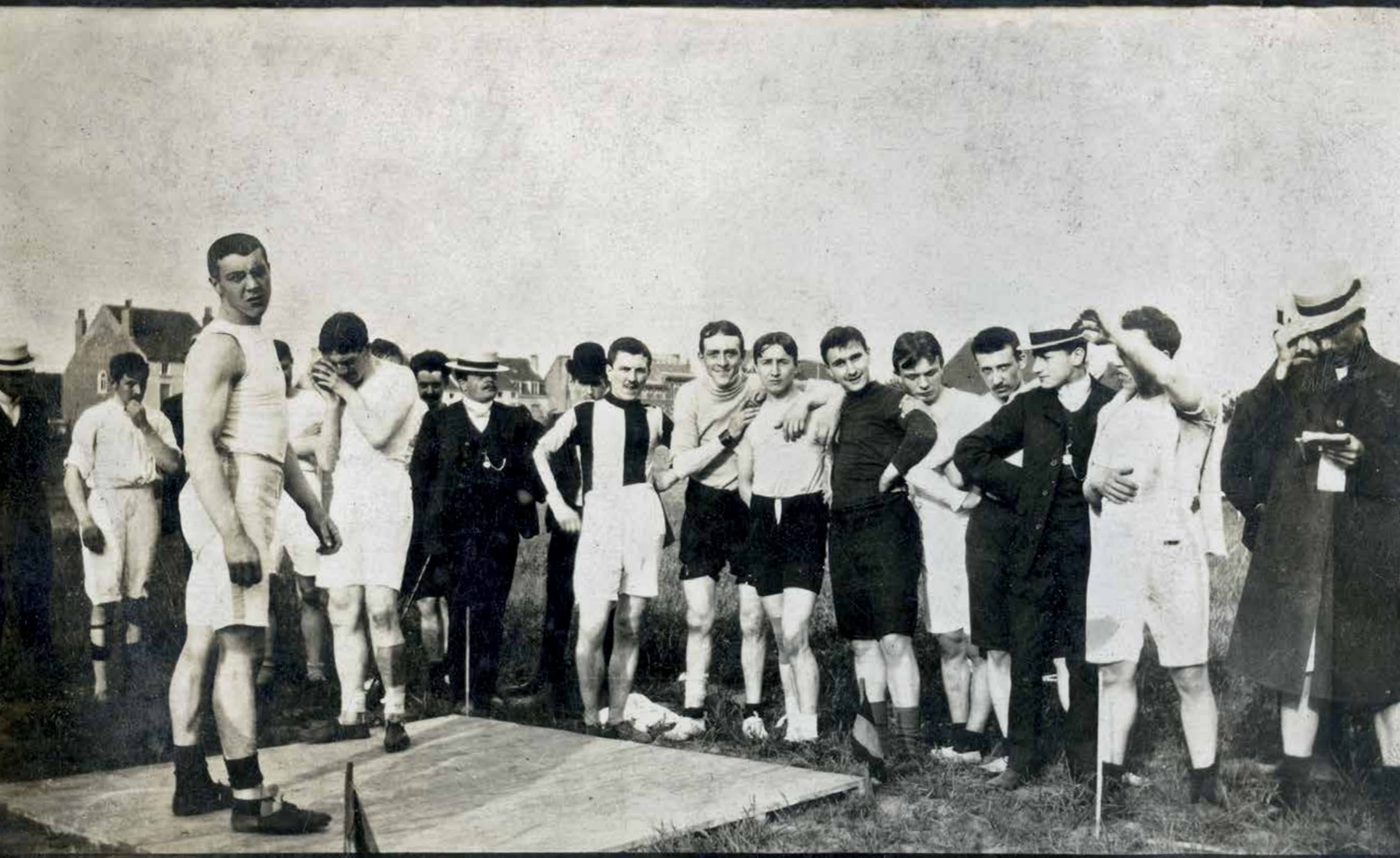
Marcel Dubois won op de tussentijdse Olympische Spelen van 1906 in Athene brons in het Grieks-Romeins worstelen (+85 kilo). Later werd hij nog zes keer Belgisch kampioen kogelstoten.