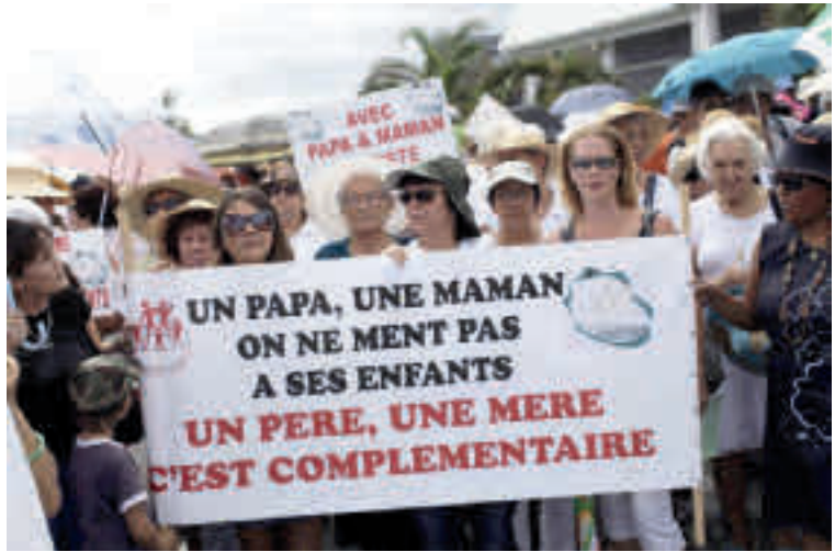
Betoging tegen het homohuwelijk in Parijs, 2013.

blijkt uit de coming-outverhalen van zowel de jongere als de oudere vertellers.