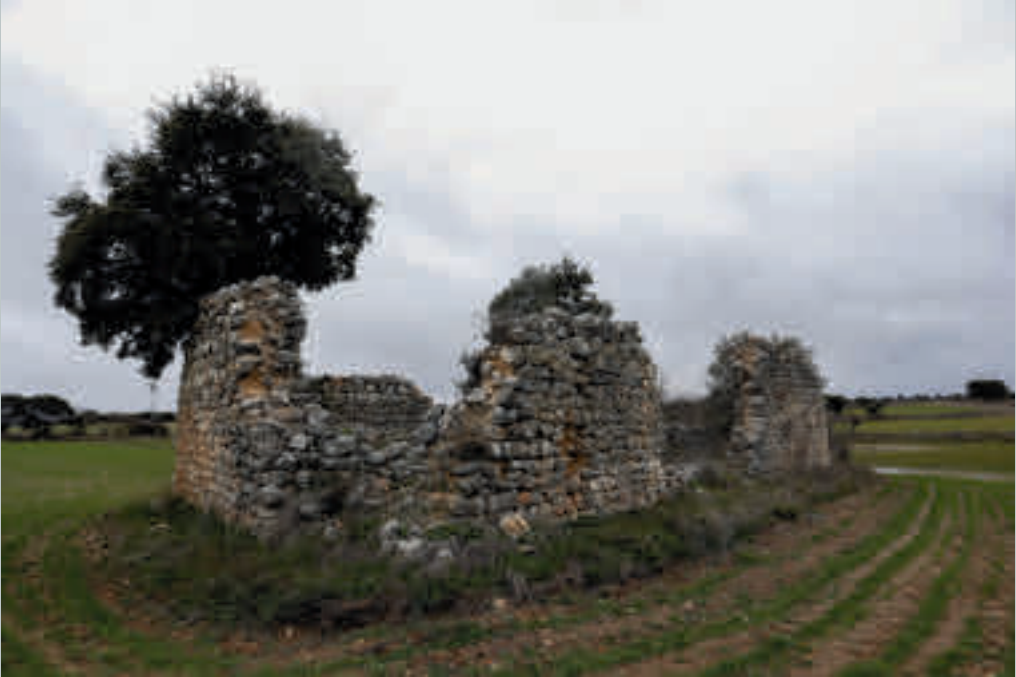
De ruïne van de Ermita de San Miguel (Algora).