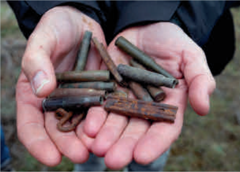
Hulzen gevonden in de buurt van loopgraven, naast de plaats waar Piet begraven werd. (privécollectie Sven Tuytens)

bij 15u in het dorp zijn, maar de weerstand van de vijand was vlugger ineengestuikt dan voorzien en om 13u waren we de toestand al meester. De bataljonskommandant bleef op zijn lauweren rusten, in plaats van onmiddellijk de verbinding met de staf tot stand te brengen. De stafofficier belast met de signalisatie voor de luchtmacht, had zijn taak niet gedaan. Onze eigen luchtmacht is ons toen komen mitrilleren! 21 Als resultaat van die aanval van de eigen luchtmacht, sneuvelden er zeven Italiaanse vrijwilligers. Volgens Regler evacueerden brancardiers de lichamen van Piet en de zeven Italianen in de buurt van een 'kapelletje in Sibirnas'. Regler is een Duitser, dus voor hem zijn de Spaanse ermitas kapelletjes. Met 'Sibirnas' bedoelt hij het grondgebied van Las Inviernas. De doden werden begraven in de buurt van de kleine Ermita die naast republikeinse loopgraven ligt.