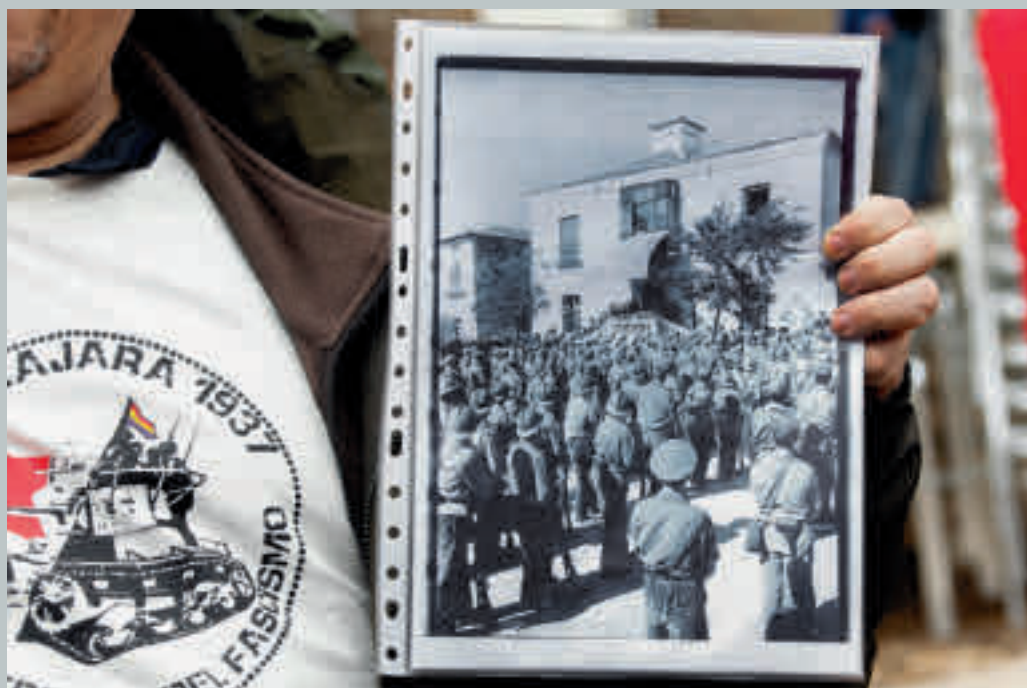
Op de herdenkingsplechtigheid op 21 maart 2015 werd een foto getoond van het hoofdkwartier van het republikeinse leger in 1937 in Torija.

Hulp. Het leven gaat verder. Akkerman. 23