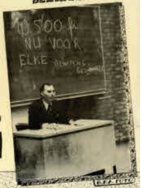
▲ Affiche van de Verenigde Aktiegroepen Gewetensbezwaarden voor een minimum maandloon van 10.500 Belgische frank voor alle gewetensbezwaarden, 1978.

MAAND- LOON VOOR ELKE GEWETENS- BEZWAARDE