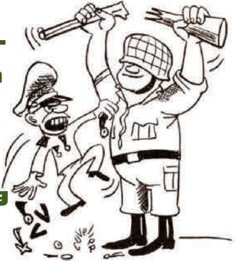
Cartoon uit De Gids voor gewetensbezwaarden , CSCJ, 1978.

Op 3 juni 1964 ondertekende koning Boudewijn de wet die het statuut van gewetensbezwaren tegen de militaire dienstplicht regelde. Een maand eerder, op 6 mei 1964, had de Kamer, na lange parlementaire debatten, de uiteindelijke tekst goedgekeurd.