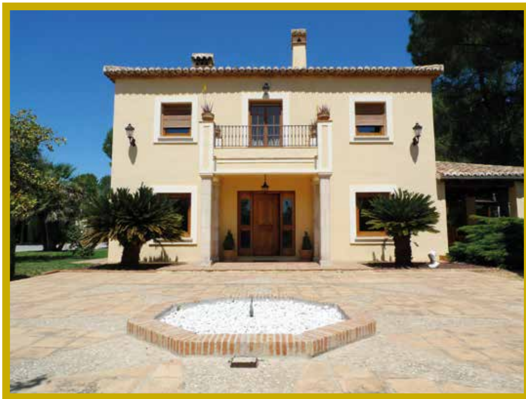
Villa El Pinatar, het verblijf van de Belgische vrijwilligsters in Ontinyent van mei 1937 tot februari 1939.