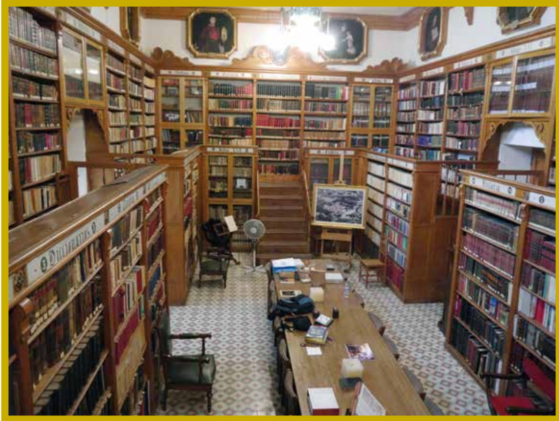
De kloosterbibliotheek.

begon een periode van wrede onderdrukking waarbij iedereen die ook maar een spoor van sympathie voor de Republiek had getoond, werd vervolgd. Tienduizenden Spanjaarden werden voor het executiepeloton geleid, gingen de gevangenis in of werden jarenlang gebruikt om slavenarbeid te verrichten voor bedrijven die goede contacten met het regime hadden.