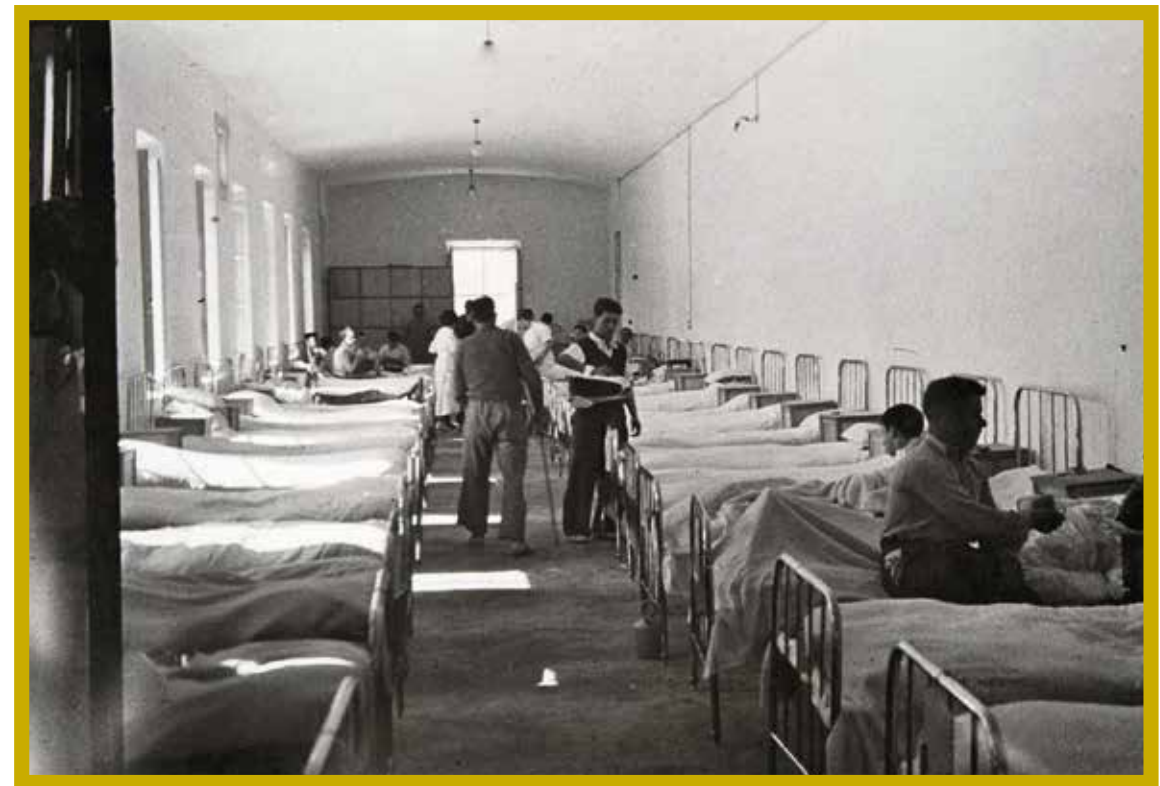
De ziekenzaal, afdeling arm- en beenkwetsuren in het militair hospitaal van Ontinyent.

In januari 1938 draaide het hospitaal op volle toeren: in die maand vonden er gemiddeld zes à zeven operaties per dag plaats. Er