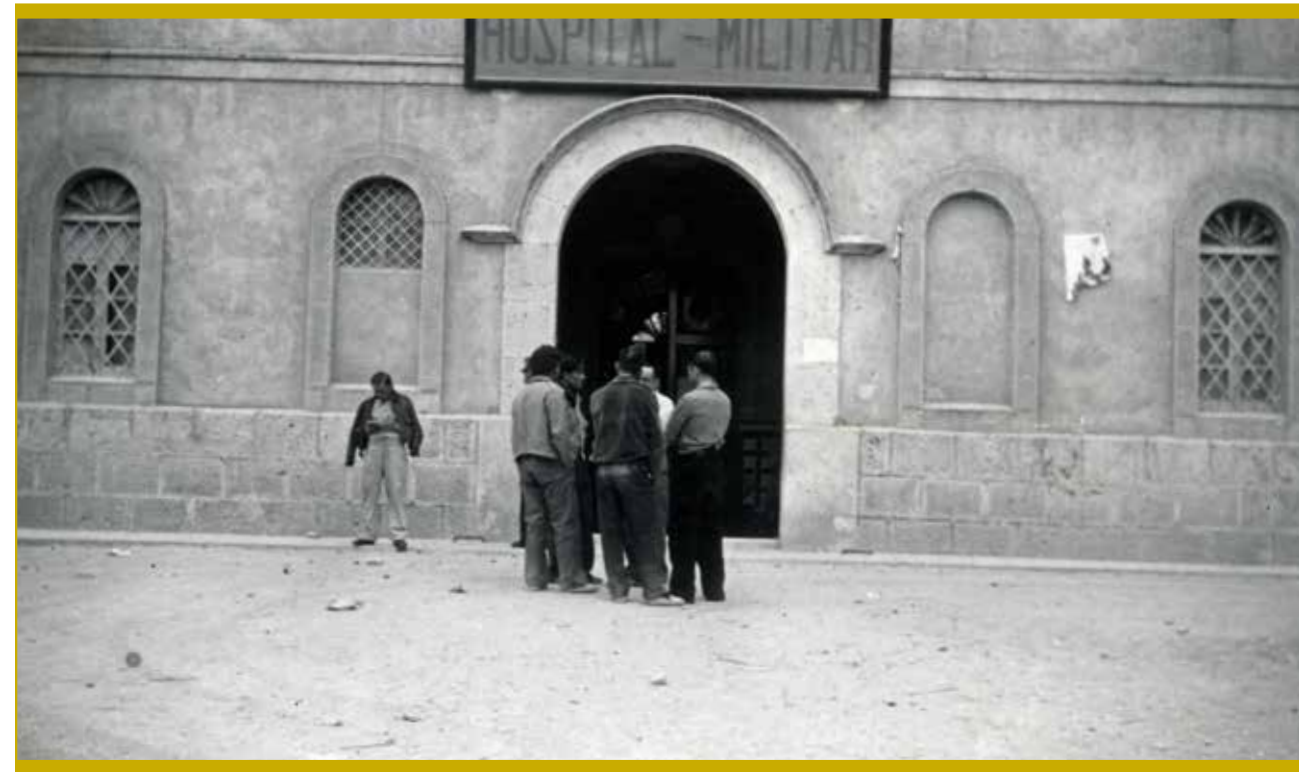
De gevel van het militair hospitaal, begin 1937.

Het militair hospitaal werd ingericht in een oud klooster van de minderbroeders, een franciscanenorde, en in het College van de Onbevleete Ontvangenis. 16 Met een geplande capaciteit van 1200 bedden zou El Belga een van de grootste en modernste hospitalen in Spanje worden. Uiteindelijk haalde het hospitaal een capaciteit van duizend bedden met een bezetting van ruim achthonderd bedden. Maar daarvoor moest het hele klooster eerst worden aangepast. Er werd centrale verwarming aangelegd en een grote goederenlift geïnstalleerd, die ook gebruikt werd om de patiënten van de operatiezalen naar hoger gelegen verdiepingen te brengen. Naast de kloostertuin kwam een therapeutisch zwembad. De kloosterkerk onderging de grootste veranderingen. In een zijbeuk moest een altaar plaatsmaken voor een grote poort, waardoor vrachtwagens de kerk konden binnenrijden. Die deed dienst als magazijn voor levensmiddelen en als opslagruimte van allerhande benodigdheden voor het hospitaal. De afgesloten kapellen dienden als kantoren voor de militairen.