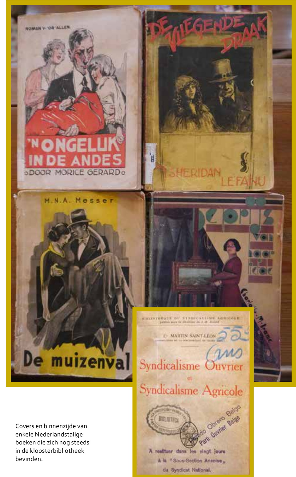
Covers en binnenzijde van enkele Nederlandstalige boeken die zich nog steeds in de kloosterbibliotheek bevinden.