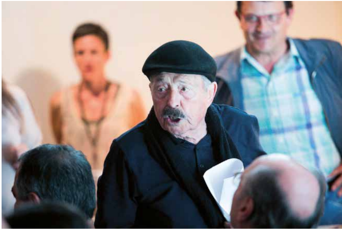
Enric Marco op een festival waar het boek El Impostor werd voorgesteld in 2016. ( http://blogs.lavanguardia.com/hemeroteca/files/2010/05/lf_marco.jpg )

sen zorgvuldig hele en halve onwaarheden uitgezet om zich te kunnen presenteren als een echte ex-concentratiekampgevangene.