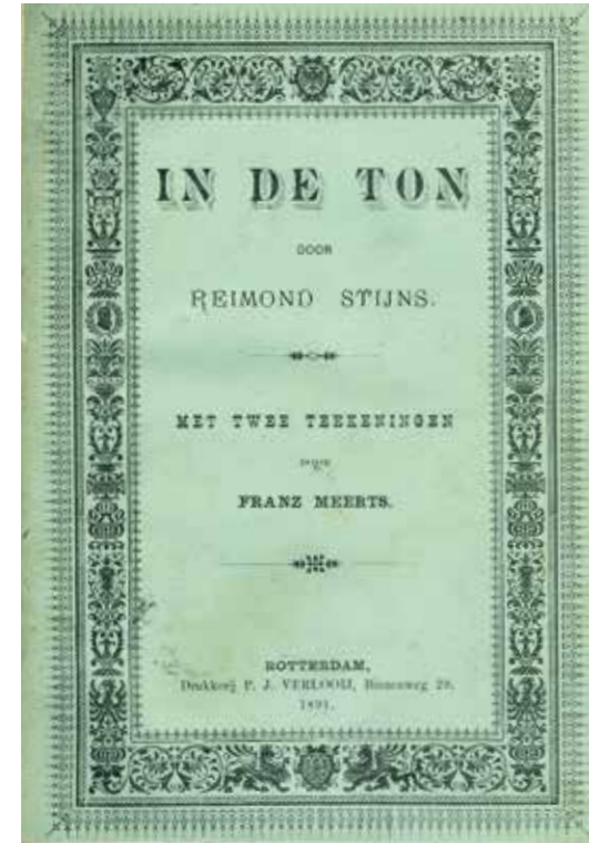
Cover van de eerste druk van In de Ton, 1891.