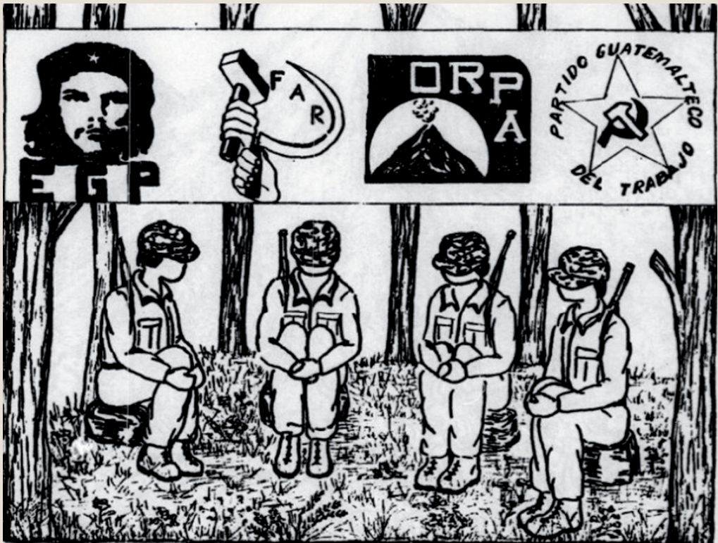
Guatemalteekse propaganda beeldt de verbroedering van de vier voornaamste guerrillafacties uit.

uit het Europese solidariteitsnetwerk. De aanwezigheid en associatie met dergelijk gepolitiseerd netwerk was op zich een subversieve daad die de volksorganisaties opnieuw in het repressieve vizier van het Guatemalteekse regime kon brengen. Toen Guatemalteekse vakbonden gevraagd werden aanwezig te zijn op de jaarlijkse Europese solidariteitsbijeenkomsten, waar de afvaardiging van de URNG een vaste plaats had verworven, spraken ze van 'zelfmoord'. De voorrang die de Europese Coördinatie verleende aan het gewapend verzet, verhinderde zeker tot begin jaren 1990 een gelijke participatie van de mensenrechtenorganisaties in het solidariteitsnetwerk. 50