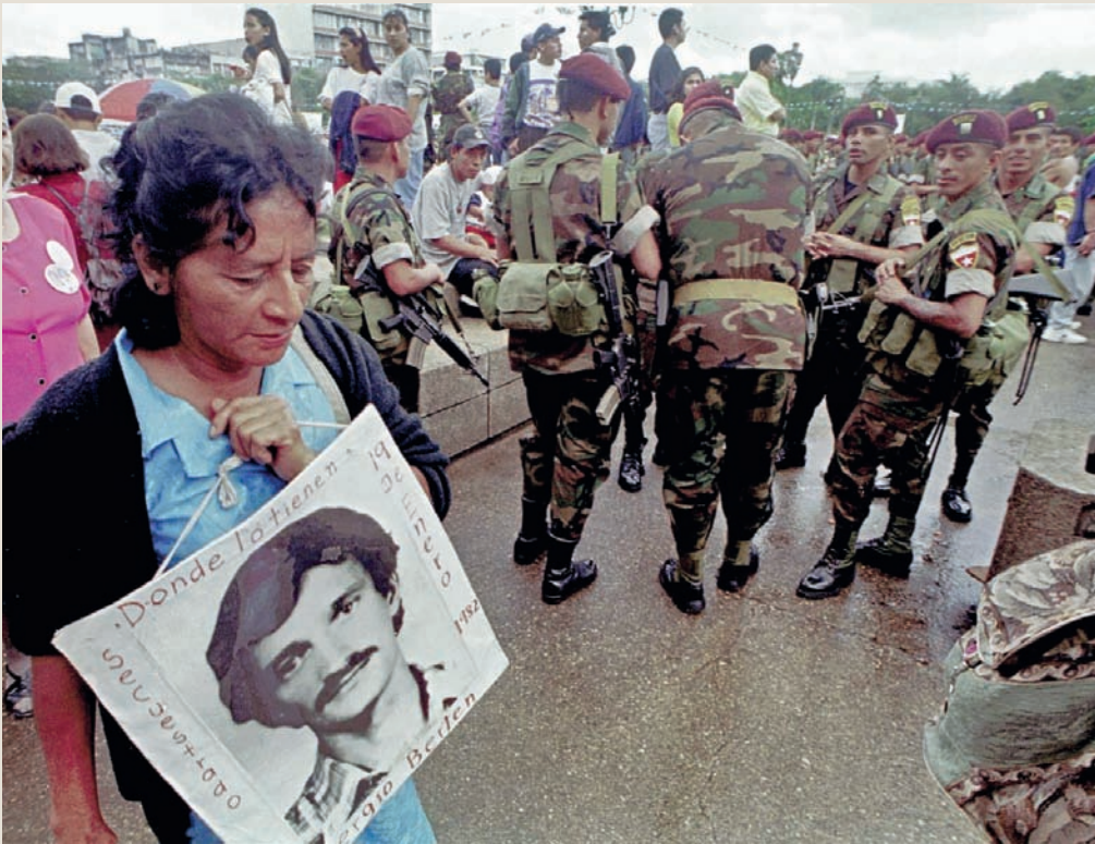
Een activiste van de Grupo de Apoyo Mutuo (GAM) draagt een foto van de in Guatemala verdwenen Vlaamse missionaris, Serge Berten.

het solidariteitsnetwerk daarmee eindelijk rekenen op een directe aanwezigheid van het Guatemalteekse verzet, maar bleef het bestaan ervan verborgen voor de meerderheid van het solidariteitsnetwerk. De komst van een Guatemalteeks vertegenwoordiger had de beweging kunnen helpen in het overstijgen van de gefragmenteerde staat van haar netwerk, maar droeg enkel bij tot de aanhoudende polarisering en de harde revolutionaire lijn.