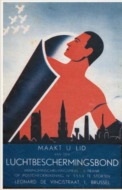
Voor- en achterflap van en illustraties uit de brochure De Bescherming tegen het Luchtgevaar . Raadgevingen van den luchtbeschermingsbond aan de bevolking, s.d.