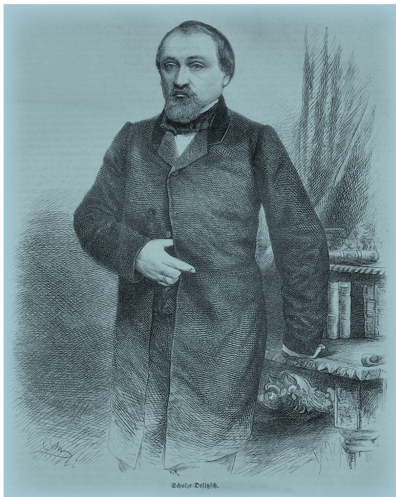
Hermann Schulze, de Duitse 'vader der volksbanken', 1863. (bron: zie p. 24)

selen. Tijdens de eerste vergadering werd meteen een centraal bureau opgericht dat de overkoepelende activiteiten moest controleren en sturen. Niemand minder dan Hermann Schulze werd verkozen tot voorzitter, een uitdagende en tijdrovende functie waarvoor hij een professioneel loon kreeg. Het centraal bureau stond de leden bij met informatie en advies over de statuten, het gaf raad aan nieuwkomers die een kredietbank wilden stichten en het trad op als bemiddelaar bij conflicten. De Duitse bond gaf ook een informatieblad uit, Blätter für Genossenschaftswesen , met aanbevelingen en argumenten om 'de uitbreiding en