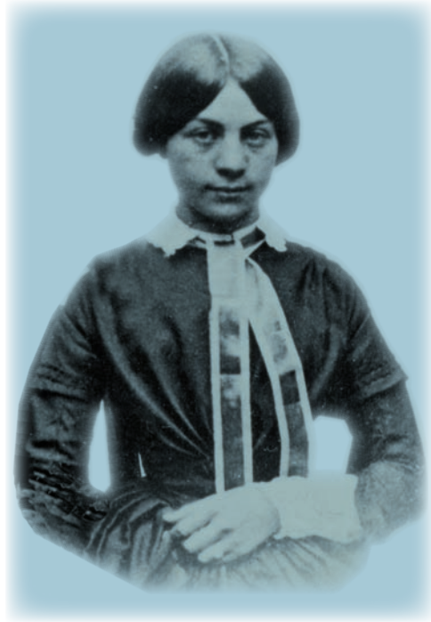
De Vlaamse schrijfster Virginia Loveling zette zich ook in voor de oprichting van een coöperatieve kredietbank. (Letterenhuis, Antwerpen)

Ondanks het optimisme en de gedrevenheid van de bestuursleden kende de Gentse volksbank een moeilijke start. Na het eerste kwartaal, in april 1867, werd er nog geen winst opgetekend. Toch maakte het bestuur zich geen grote zorgen: 'Er is geen voorbeeld van een versch geplante boom die vruchten gaf eer dat hij wortels geschoten had. Er is geen voorbeeld van eene financieele onderneming die, na zoo korten tijd bestaans, winsten deed, en dit om de eenvoudige reden dat de algemene kosten, namelijk huur van lokaal en bezoldiging van beambten, hoe redelijk ook, gerekend zijn in evenredigheid met eenen cijfer van zaken dien het even zoo onmogelijk is van den beginne te bereiken, als het later gemakkelijk wordt.' 66 Na één jaar waren de initiatiefnemers nog steeds overtuigd van de maatschappelijke meerwaarde en de