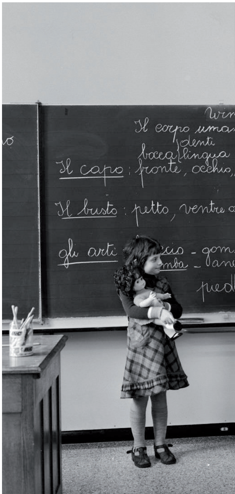
Leerlingen uit Winterslag tijdens een Italiaanse les, 1978.