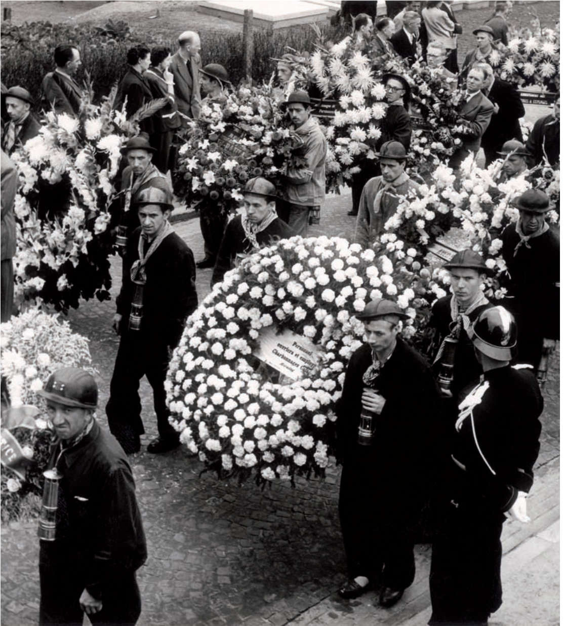
Begrafenisstoet van mijnwerkers na de ramp in Marcinelle, 18 augustus 1956.