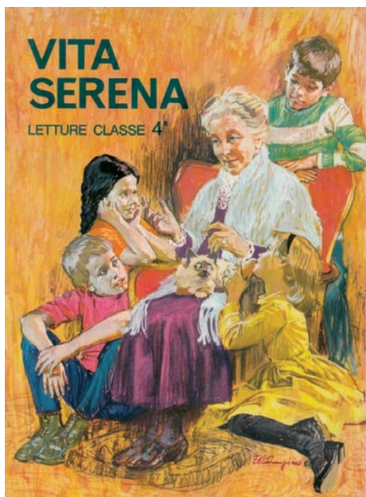
Cover van een libro de lettura of leesboek. (U.VALLI), L.BERTANI, Vita serena. Letture per le scuole elementari. Classe quarta , Milaan, S.E.C.I.)

naschoolse cursussen organiseerde, voor in totaal 1918 leerlingen. Er werden 19 lesgevers aangeworven. Zij werden ter plekke gerekruteerd en kregen een contract van bepaalde duur. Uit die verslagen blijkt verder dat de Direzione didattica ook lessen voor haar rekening nam in het reguliere onderwijs. Daar werden 7 klassen gestart voor in totaal 148 leerlingen. Vijf leerkrachten kwamen uit Italië. Zij waren 'op missie' en gingen voltijds aan de slag. Twee anderen werden ter plekke gerekruteerd en kregen een deeltijds contract. Wellicht gaat het om klassen in scholen waar tweetalig onderwijs Italiaans-Nederlands werd gegeven. Limburg telde in die tijd enkele tweetalige scholen, zoals verderop te lezen is.