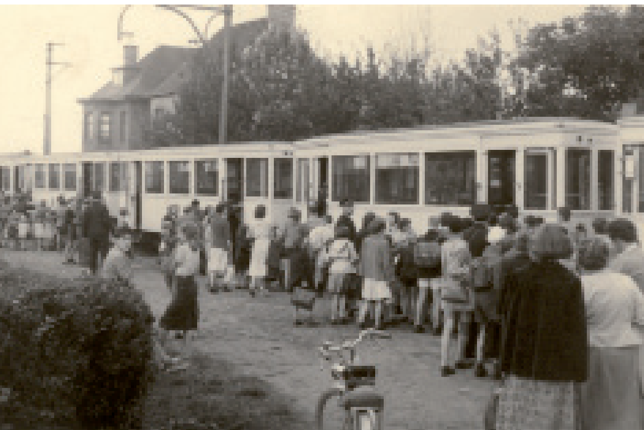
De Kollebloem was vrij makkelijk te bereiken met het openbaar vervoer.