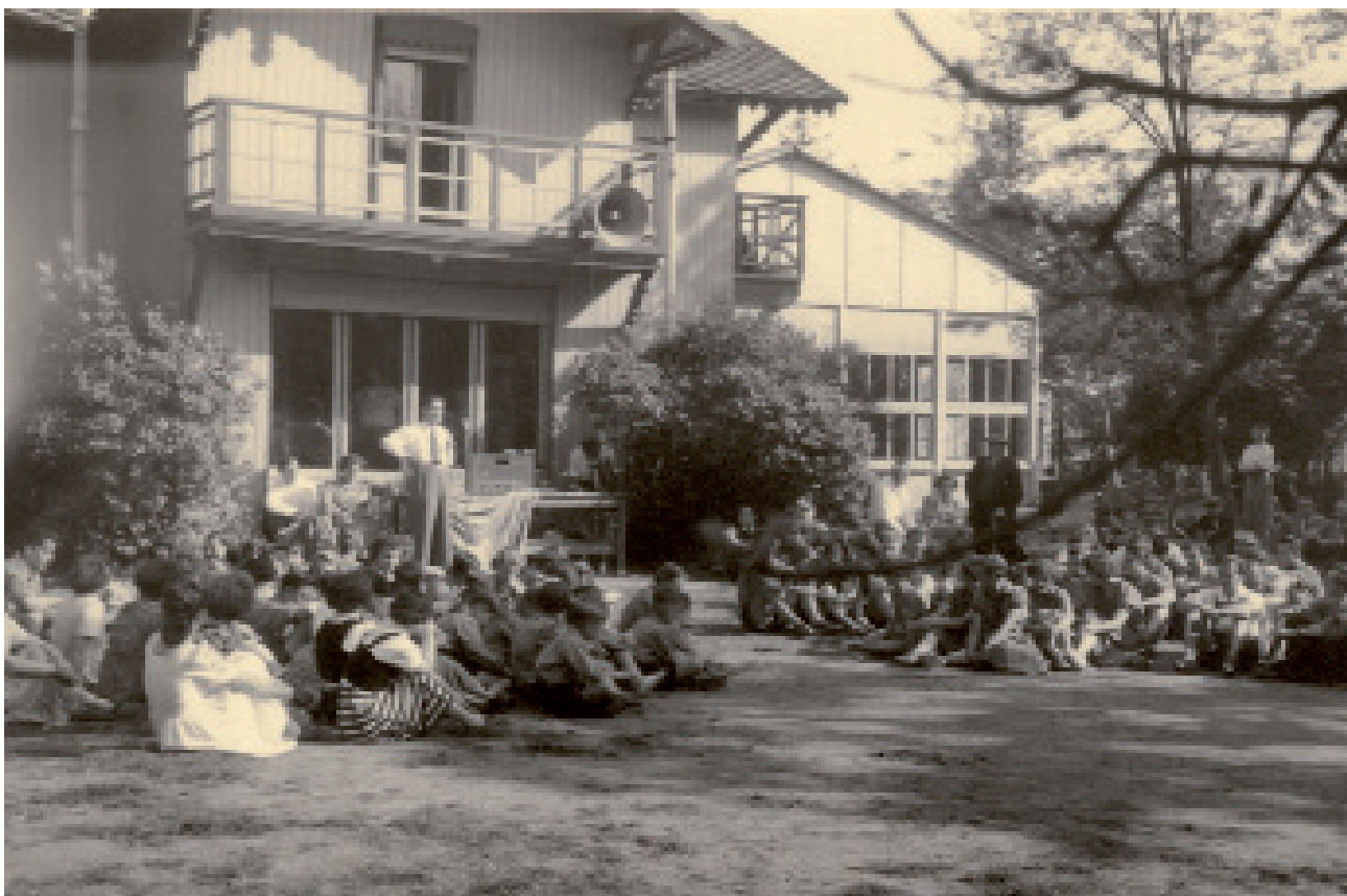
Kinderen en monitoren op het domein van De Kollebloem in Heusden.

De Kollebloem was vrij makkelijk te bereiken met het openbaar vervoer. Het terrein werd begrensd door de in 1891 aangelegde tramlijn Gent – Wetteren – Hamme, die vertrok in de Heirniswijk, vlak bij het station Gent-Dampoort. In die bedding kwam later de Heusdense Magerstraat. De halte aan café ‘Het Zandhekken’, op de hoek met de Leenstraat, lag vlak bij De Kollebloem. Enkele ondernemers en helpende handen maakten de gebouwen bewoonbaar en geschikt voor gebruik, boorden een artesische put en richtten wasinstallaties met stortbaden en wc’s in. Na twee jaar werd een ruime, heldere eetzaal van 11 bij 16 meter