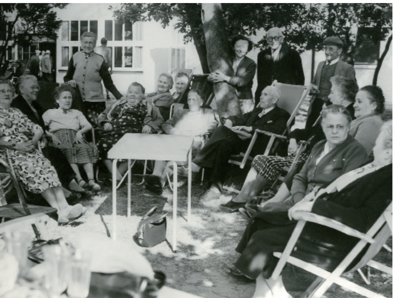
Bejaarden in het vakantiehuis De Kollebloem, juni 1959.

de steenweg naar Laarne (Laarnebaan), wellicht om ook langs die kant een uitweg te hebben.