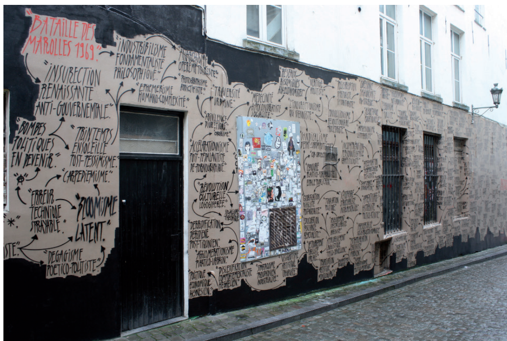
Grffiti van Obète in de Kandelaaarsstraat in Brussel, 2013. © Foto: Xavier Claes (In: Anne MORELLI (red.), Le Bruxelles des révolutionnaires. De 1830 à nos jours , Brussel: CFC éditions, 2016, p. 268)

binnen de Russische partij, ging door in Brussel. En onder het Martelarenplein, op de plaats waar (een deel van) de Vlaamse regering gehuisvest is, ligt een massagraf van 466 Brusselaars, Vlamingen, Walen en zelfs een paar buitenlanders. Ze gaven hun leven voor het ontstaan van België en verbonden daarmee hun naam aan het plein ... Maar van dat alles wist ik hoegenaamd niks.