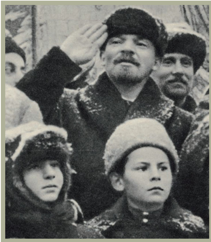
Postkaart met een foto van Lenin op het Rode Plein in Moskou tijdens de viering van de tweede verjaardag van de Oktoberrevolutie op 7 november 1919. (Amsab-ISG, Gent)

Een jaar later werd de Spartakusopstand met de moord op Rosa Luxemburg en Karl Liebknecht de kop ingedrukt.