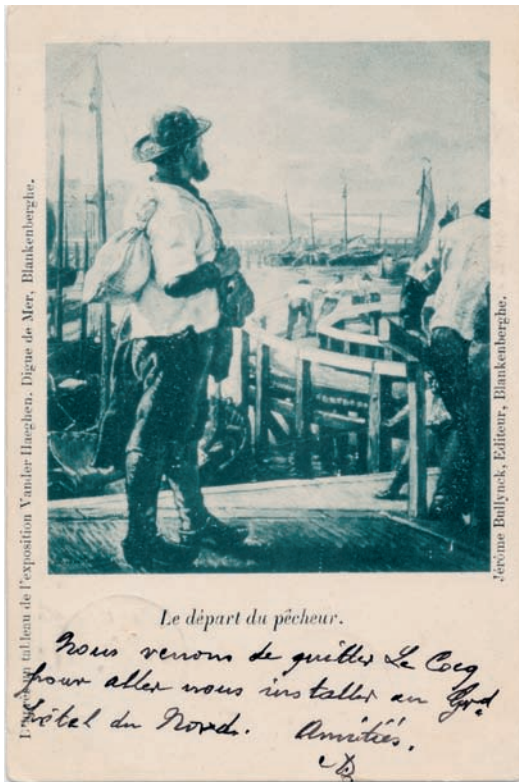
Edmond Van der Haeghen inspireerde zich vooral op de vissersbevolking, zoals in het schilderij Le départ du pêcheur , dat ook als prentkaart werd verspreid.

belle époque. Een daarvan afgeleide tekening werd gebruikt als illustratie bij een plan ter promotie van de oostelijke uitbreiding van Westende. Het is mogelijk dat de tekening ook op een toeristische affiche belandde.