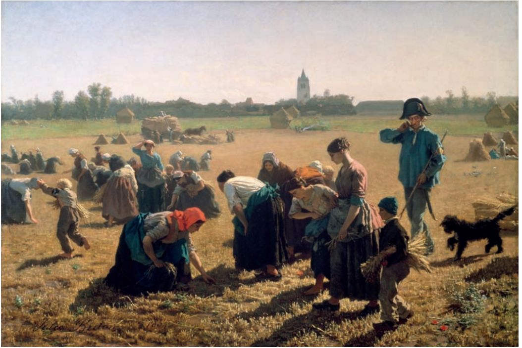
Les Glaneuses , een schilderij van Jules Breton uit 1854.

nabijheid van stedelijke centra bevond: 'Want wat ziet men daar? Het zijn net die mensen die hele dagen slijten op café die tijdens de oogstperiode komen rapen (arenlezen) op de naburige velden, tot groot nadeel van de inwoners – en vooral dan de behoeftigen – van de plattelandsgemeenten.' 47