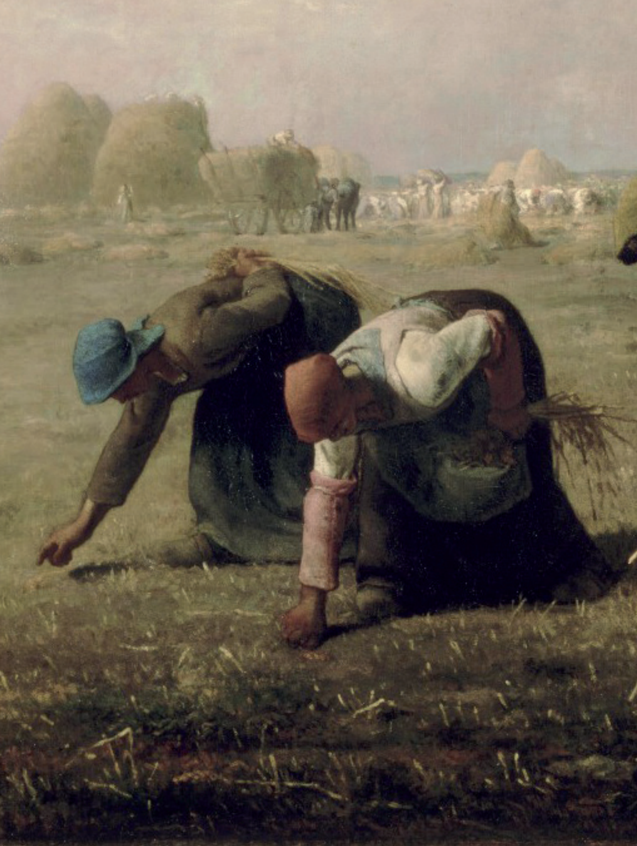
Detail uit Des Glaneuses , een schilderij van Jean-François Millet uit 1857. (© Musée d'Orsay, Parijs)