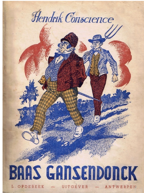
Cover van Baes Gansendonck , een roman van Hendrik Conscience uit 1850.

In elk van de historische en hedendaagse conflicten over rapen is de betekenis als gebruiksrecht, diefstal of protest ook steeds gelijktijdig aanwezig, wat een onderhandelingsruimte bood voor de betrokken partijen – hoewel er vaak een duidelijk machtsonevenwicht tussen hen bestond. Om dit te illustreren verwijs ik naar volgende passage uit een klassieker binnen de 'Vlaamse letteren', namelijk Hendrik Conscience's Baes Gansendonck uit 1850. Meer bepaald naar Conscience's satirisch-moraliserende portrettering van de ontmoeting tussen het arrivistisch hoofdpersonage Baes Gansendonck, diens knecht en een arme vrouw die samen met haar kinderen hout aan het sprokkelen was in een bos dat eigendom was van het hoofdpersonage. Toen Gansendonck de houtsprokkelaars opmerkte, riep hij hen toe: 'Onbeschaemde houtdieven! Op, vooruit, mede naer het dorp! In de handen der gendarmen! Naer het kot luije schelmen!' De vrouw zette de situatie echter naar haar hand