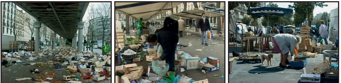
Stills uit Les glaneurs et la glaneuse , een film van Agnès Varda uit 2000. (bron: p. 19)

Om de vermeende kloof te overbruggen tussen enerzijds de laatmoderne vormen van rapen als 'protest' en anderzijds de 19e-eeuwse raaptaferelen als 'overlevingsstrategie' ligt het op het eerste gezicht voor de hand om terug te grijpen naar het conceptuele kader van de social crime . 15 Gaan immers zowel de laatmoderne als de 19e-eeuwse vormen van rapen in essentie niet over conflicten in het kader van 'alledaagse consumptie', over een 'recht op voedsel' dat primeert op de wetten van de markt? De kiemen van het social crime -concept zijn terug te vinden in de studies van de British Marxist Historians uit de jaren 1950-1960 over sociale strijd van onderuit tijdens de moderne periode. 16