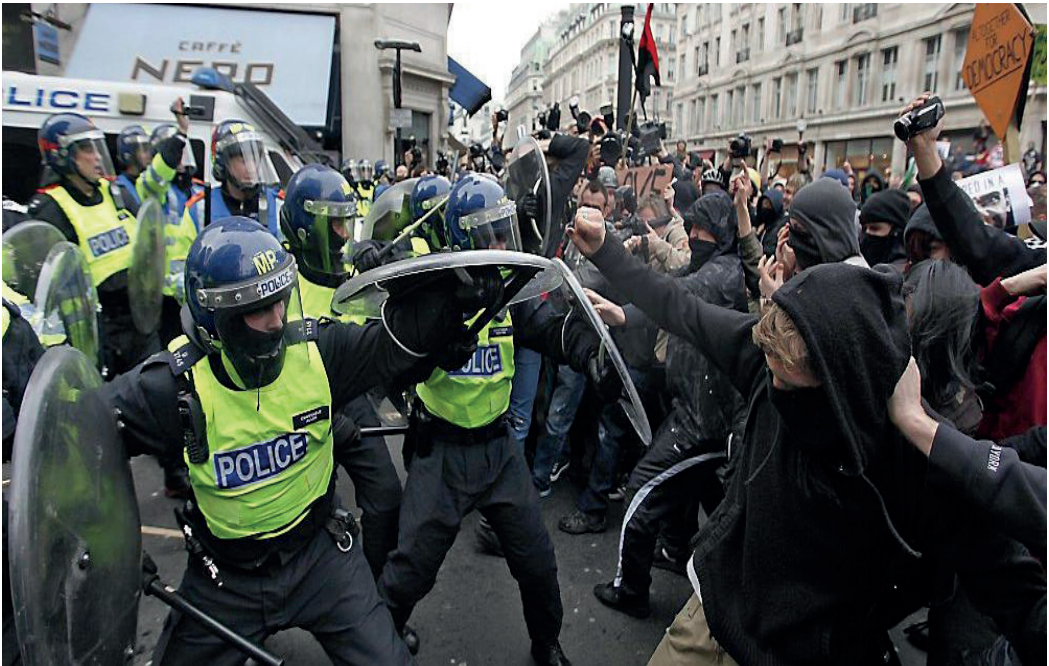
De rellen in Londen in augustus 2011.

‘Er wordt ons voortdurend verteld dat shoppen de oplossing van al onze problemen is, en het recept voor een goed leven – maar voor een groot deel van de bevolking is deze levensstijl onbereikbaar. De rellen moeten daarom best begrepen worden als een revolutie van gefrustreerde consumenten’. 18 Naast de gevierde Wolf of Wall Street waren dit de gefrustreerde wolves of high street .