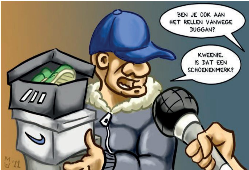
Karikatuur over de rellen in Engeland in 2011.

Net als tijdens het carnavalsfeest werden de dagelijkse machtsrelaties daarbij kortstondig op hun kop gezet en namen de klassieke onderdanen de plaats in van de machthebbers. In 2011 spraken deelnemers in gelijkaardige termen over de rellen. Een 22-jarige werkloze man uit Manchester verklaarde dat 'het gigantische politiestation voor één dag van ons was. In Salford [een wijk in Manchester, red.] heerste er een party -sfeer. Iedereen stond buiten, te drinken ... wiet te roken, te lachen'. 34 Een 16-jarig meisje had het over 'een festival zonder eten, zonder drinken, zonder muziek, maar een gratis shopping trip voor iedereen'. 35 De deelnemers verwezen zelf naar het ongebruikelijke karakter van deze machtsomkering: 'Dit is niet zomaar zoals iedere andere dag ... niet zomaar een normale, routineuze strontdag, same-old same-old '. 36 Net als in de 18e eeuw zijn de huidige rellen geen alledaagse gebeurtenis: het oproer