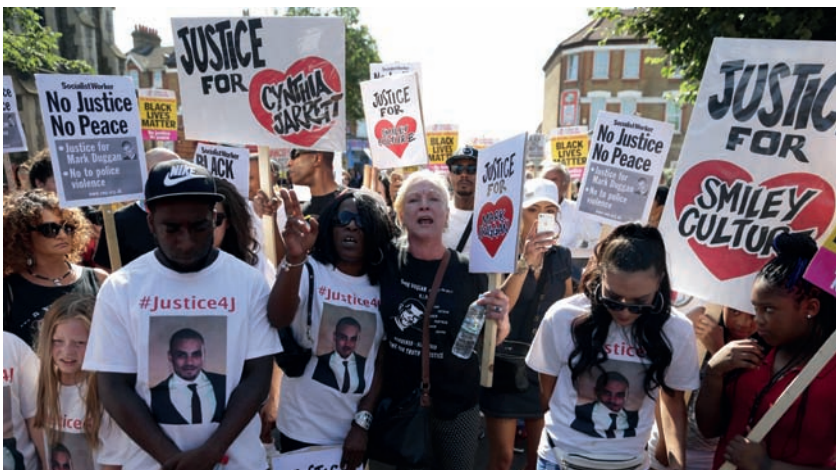
Links: solidariteitsmars voor Mark Duggan en andere slachtoffers van politiegeweld, augustus 2011.

zou staan. Een lokale inspecteur werd wandelen gestuurd. Het protest verliep vreedzaam, maar tegen de avond werd de sfeer grimmiger. Omstanders staken twee politiewagens in brand. Dit was het startschot voor vier broeierige zomernachten. De plunderingen in Tottenham hielden aan tot zonsopgang de volgende dag. In de drie volgende nachten breidden de onlusten zich uit over heel Groot-Londen (in 22 van de 32 boroughs ) en naar andere grootsteden als Bristol, Birmingham, Leeds, Liverpool en Manchester. Jongeren kwamen overal in Engeland massaal op straat om brand te stichten, winkels te plunderen en politieagenten aan te vallen. De Engelse krant The Guardian stelde later in een onderzoeksrapport dat 'de derde nacht van het oproer [...] een van de meest intense 24 uren van burgerlijke onrust in de recente Engelse geschiedenis was.' 3 In totaal werden in 66 verschillende politieregio's onlusten geregistreerd. In Londen werden 16.000 agenten op de been gebracht om de rust te herstellen. Volgens sommigen was het niet zozeer hun inbreng, maar wel de aanhoudende regen die ten slotte het einde van de onlusten inluidde. Eindbalans van vier hete zomernachten: 5 doden, 2.278 geplunderde