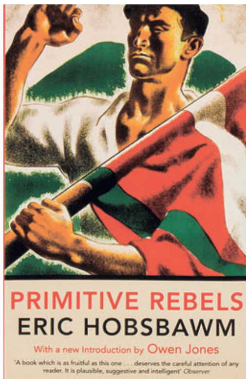
Cover van Primitive Rebels .

Voor een dergelijke benadering is het misschien zinvol om terug te keren in de geschiedenis en een fenomeen te belichten dat minder nabij is en minder directe emoties oproept. De Britse historicus Eric Hobsbawm worstelde in 1959 met een gelijkaardig probleem in zijn boekje Primitive Rebels . 20 In die publicatie trachtte hij tot een beter politiek begrip te komen van fenomenen die door historici tot dan toe vaak als apolitiek, primitief en marginaal waren weggezet, zoals outlaws , de maffia, en het sektarische 'millennialisme'. Volgens Hobsbawm hadden historici, 'meestal hoogopgeleide stedelingen', tot dan toe echter te weinig moeite gedaan om een beter inzicht te verwerven in deze fenomenen omdat ze te ver van hun bed lagen. 21 In zijn analyse besteedde hij ook aandacht aan 'het oproer van de stadsmeute'. Deze stadsmeute ( the city mob ) was een onsamenvangende verzameling mensen die de onderlagen van de pre-industriële steden bevolkte. Die bandeloze groep bestond uit traditionele loonwerkers en ambachtslieden zoals leerlooiers, marktkramers, touwslagers, scharenslijpers, kleermakers, dokwerkers, straatventers, slagers, vissers, smeden, maar ook uit groepen die tussen de formele en informele economie in leefden, zoals bedelaars, vagebonden, zak-