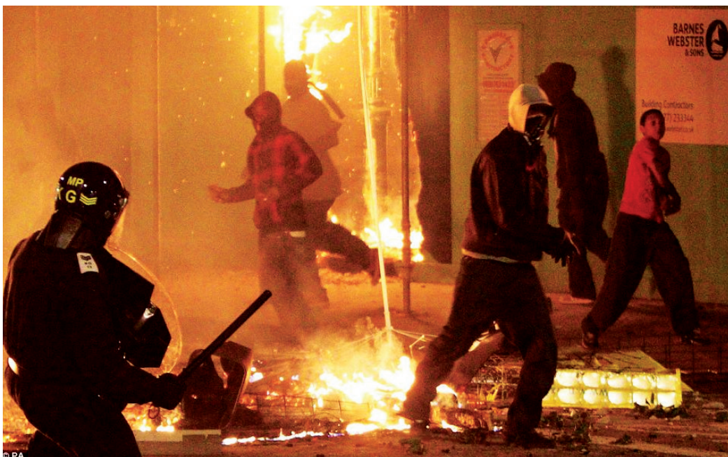
De rellen in Londen in augustus 2011.

voldoende ontwikkeld om hun frustraties op een 'politieke' manier te uiten. Volgens enkele Britse criminologen lag het bewijs hiervoor in het feit dat 'er geen woordvoerders opstonden om hun collectief ongenoegen onder woorden te brengen'. 14 Andere wetenschappers trachtten wel om de politieke aspiraties van de jongeren te ontsluiten en hadden het over een vorm van 'protopolitiek' of 'subpolitiek' protest. 15 Zij zagen de rellen niet als een gebrek aan politiek bewustzijn, maar als de uiting van een politiek bewustzijn-in-wording. Zij stelden dat deze jongeren zich langzaam bewust werden van de onrechtvaardigheden en mistoestanden in hun leefwereld en dat ze onbeholpen op zoek gingen naar manieren om hun ongenoegen te uiten. De Britse sociologe Adiya Akram argumenteerde dat 'hun grieven zich niet noodzakelijk in herkenbare politieke acties vertaalden [...] maar dat de rellen onmisken-