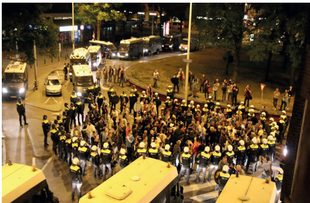
De rellen in de Haagse Schilderswijk, 2015.

lieden, magistraten en burgemeesters de stuipen op het lijf joeg’. 32 Bij de Londense onlusten van 2011 moet het ontbreken van woordvoerders en programma’s dus niet per se als een zwakbod worden beschouwd. De verbonden bandana’s en opgeslagen hoodies maakten net een veel intimiderender optreden mogelijk. Zo verklaarde een anonieme betoger aan de krant The Guardian : ‘Het was een oorlog en we hebben de politie doodsbang gemaakt. Voor één keer waren wij het niet die bang waren’. 33 Deze anonimiteit wortelt dus in een langere traditie van stedelijk protest. Thompson vatte dit pre-industriële protest op als een vorm van ‘contratheater’. Net als het elitaire machtsvertoon volgde dit volkse oproer immers ook theatrale regels. Daarbij werd de staat omgebouwd tot een carnavalesk schouwtoneel waarin de stedelijke onderklasse voor één keer de hoofdrol speelde.