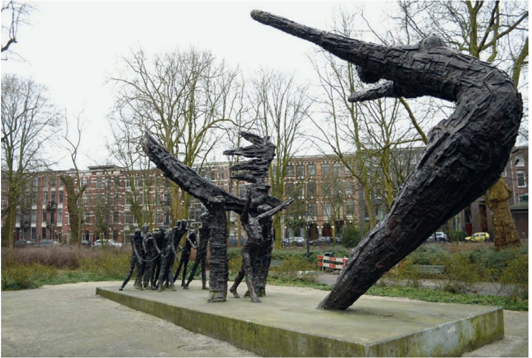
Het Nationaal Monument ter herdenking van het Nederlandse slavernijverleden in het Oosterpark in Amsterdam, 2016.

de Stichting Nationaal Monument Nederlands Slavernijverleden. 51 Die stichting verenigde achttien Afro-Nederlandse organisaties en werd door de Nederlandse regering als officiële gesprekspartner erkend. Een jaar later, op 1 juli 2002, onthulde koningin Beatrix plechtig het Nationaal Monument Nederlands Slavernijverleden in het Amsterdamse Oosterpark. De Nederlandse overheid besliste dat het monument uit zowel een 'statisch deel', het fysieke monument, als een 'dynamisch deel' zou bestaan. Dit dynamische gedeelte zou worden belichaamd door het Nederlands Instituut voor Nederlands Slavernijverleden en Erfenis (NiNsee), dat de drievoudige functie van 'reflectie, educatie, en wetenschappelijk onderzoek' rond het Nederlandse slavernijverleden kreeg toegewezen. 52 Ook nu staat het Nationaal Monument in het Oosterpark nog steeds centraal in de herinnering aan de slavernijgeschiedenis. Het vormt ook het