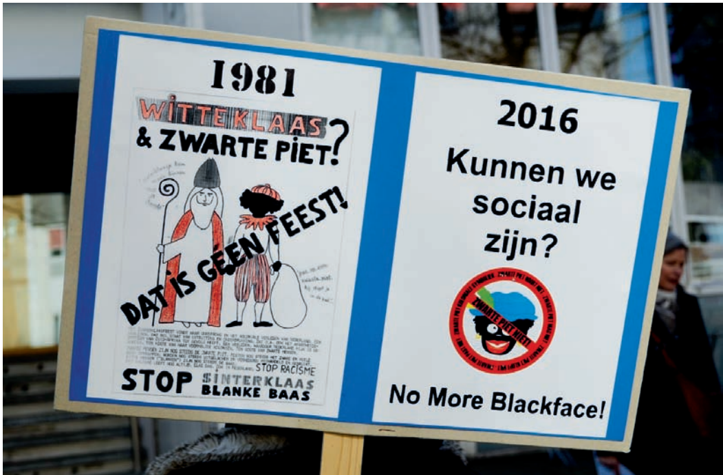
Bij een actie in 2016 gebruikte een van de activisten een affiche uit de jaren 1980. De actiegroepjes uit die periode zijn er nooit in geslaagd het debat rond Zwarte Piet op een nationaal niveau te tillen.

Centraal tijdens die gatherings stonden 'the experiences, the knowledge and the ideas of black people' . 31 NUC motiveerde dergelijke avonden vanuit de overtuiging dat het dominante denken in Nederland over kolonialisme en over slavernij, zoals vertegenwoordigd in schoolboeken, musea, herdenkingsplechtigheden en -monumenten, nog niet volledig is bevrijd van het denken dat dat onrecht mee mogelijk heeft gemaakt. Volgens NUC is het onmogelijk om een racismedebat te voeren wanneer de fundamentele van dit dominante denken over slavernij en kolonialisme nog niet zijn blootgelegd en bevraagd. 32