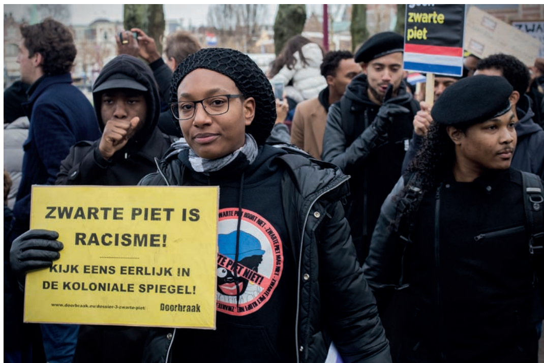
Een anti-Zwarte Pietactie aan het Museumplein in Amsterdam, december 2015.

snel mogelijk uit het Nederlandse straatbeeld zien verdwijnen, speelt de claim rond een gebrek aan 'erkenning' voor het Nederlandse slavernijverleden een hoofdrol. In dit artikel benader ik het activisme tegen Zwarte Piet daarom als een manifestatie van wat internationale academici 'erkenningpolitiek' noemen. 9 Daarbij ga ik dieper in op de heterogeniteit van hedendaagse acties tegen Zwarte Piet en schets ik kort het internationale debat over erkenningpolitiek. Het begrip 'erkenning' is terecht aan veel kritiek onderhevig. Zowel diegenen die erom vragen als diegenen die het, al dan niet in een academische context, bestuderen, expliciteren zelden wat ze er concreet mee bedoelen en welke politiek dan precies moet worden gevoerd om 'erkenning' te laten plaatsvinden. Bovendien menen critici aan de linker- én rechterzijde van het politieke spectrum dat de hedendaagse inflatie aan erkenningseisen