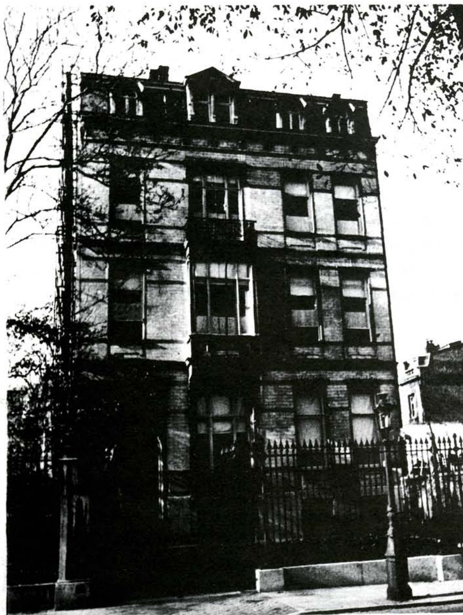
Het Nationaal Instituut voor Sociale Geschiedenis, Brussel

van de socialistische verzekeringsmaatschappij "La Prévoyance Sociale - De Sociale Voorzorg". Dit instituut was een socialistisch initiatief, maar het had een pluralistische opzet. Mensen uit de politieke en wetenschappelijke wereld van diverse ideologische strekkingen vormden een "technisch raadplegend comité" dat borg stond voor het wetenschappelijk peil. De Tweede Wereldoorlog betekende het einde van dit projekt.