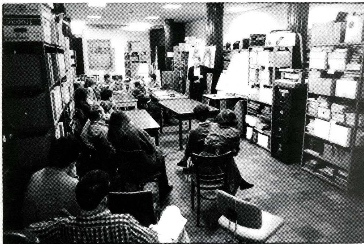
De architect bespreekt de plannen voor de nieuwe infrastructuur met het personeel.

Tot 1980 gebeurde het werk door vrijwilligers. Eind 1980 kon één bediende aan het werk als restaurateur van affiches in het kader van een op te richten Museum van de Vlaamse Sociale Strijd. Het volgend jaar kwam de eerste navorser in dienst. Zijn opdracht was het katalogiseren van de bibliotheek en het repertoriëren van de Vlaamse socialistische periodieken. In diverse BTK-, DAC- en TWW- projecten werden mensen aangenomen voor de inventarisatie van archieven, ikonografisch materiaal e.d.m. Eind 1985 werkten bij het AMSAB 15 vorsers, 8 administratieve krachten, waarvan 4 deeltijds en 5 technische personeelsleden : samen 28 mensen. De tijdelijkheid van de projecten zorgt evenwel konstant voor schommelingen in het personeelsbestand.