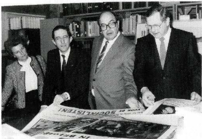
Groeiende waardering van socialistische mandatarissen voor de werking van AMSAB.