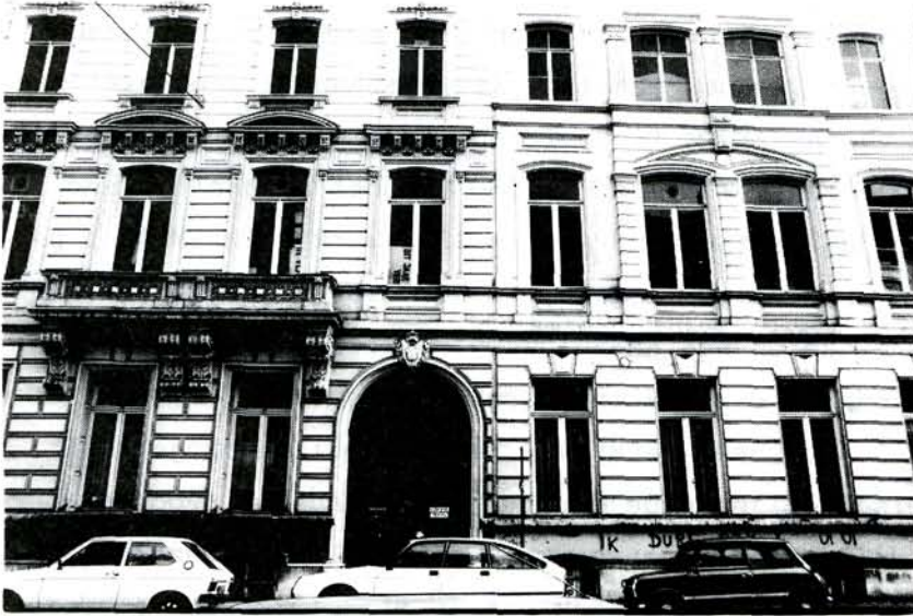
De nieuwe huisvesting van AMSAB in de Bagattenstraat, Gent