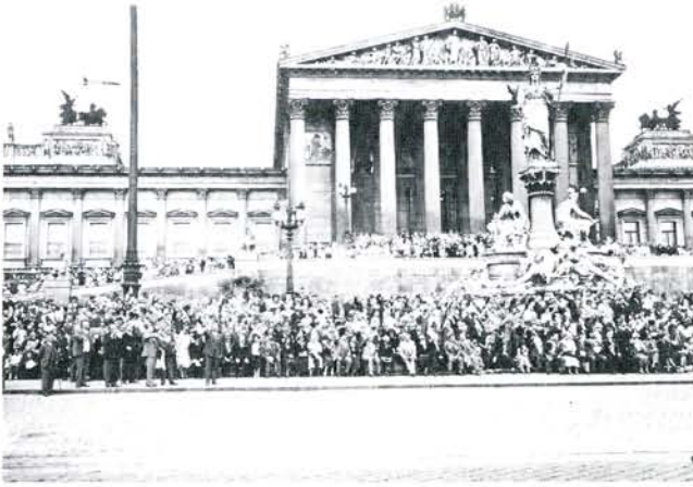
Het Rode Wenen. Gedelegeerden op het kongres van de Socialistische Arbeidersinternationale te Wenen, 1931.