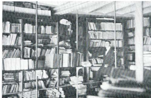
Les archives du socialisme. Eén der taken van het internationaal socialistisch bureau voor 1914 was de 'créer les archives du socialisme'. Op de foto: het internationaal sekretariaat in het Brusselse volkshuis.