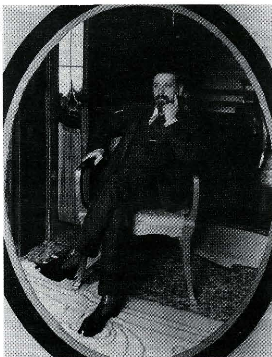
Baron Horta, architect van het Brusselse Volkshuis.

Mei 1895: De Brusselse coöperatie koopt een stuk bouwgrond in de Stevensstraat; 13 are voor 228.000 fr. V. Horta tekent de plannen voor het Volkshuis. Hij krijgt de bijnaam 'de Stillekens aan' gezien de aanvankelijk moeizame vooruitgang van de bouwwerken.