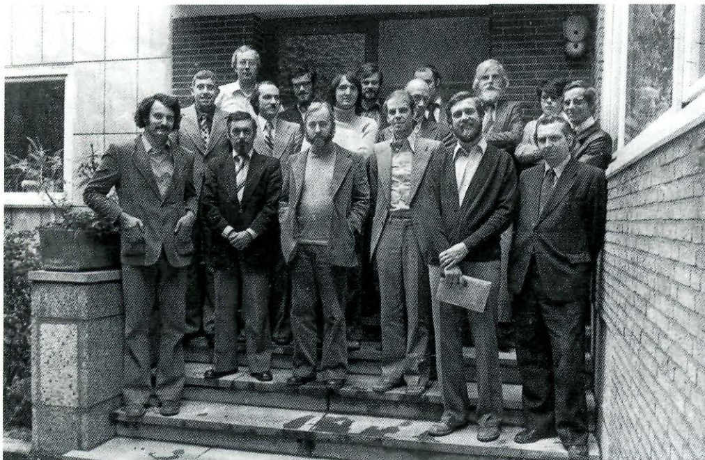
De oudleerlingenbond van HISKWA (1987).