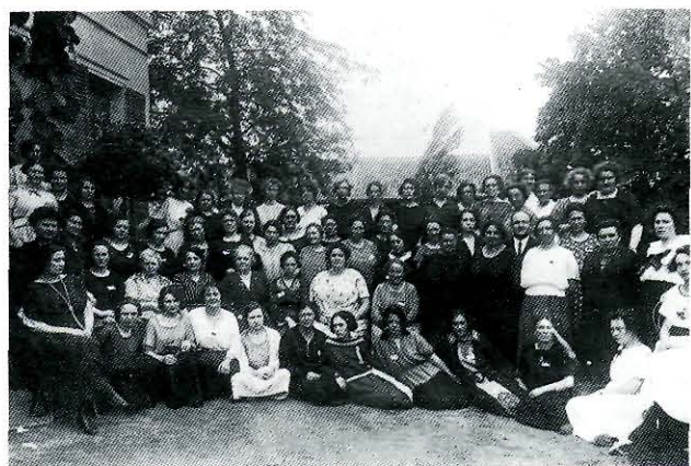
De "Eerste Vrouwenweek" in de "Hogeschool van den Arbeid", Ukkel 2 tot 8 september 1923.