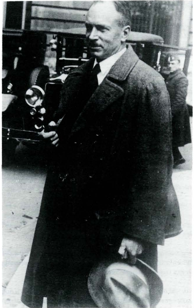
Hendrik de Man in 1937.