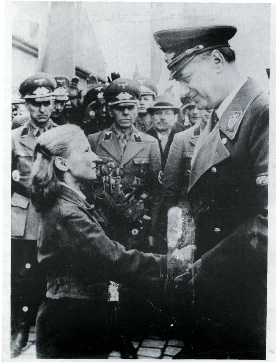
Rozen voor Alfred Rosenberg (1893-1946), die als "Beauftragter des Führers" de archiefroof in ons land organiseerde.