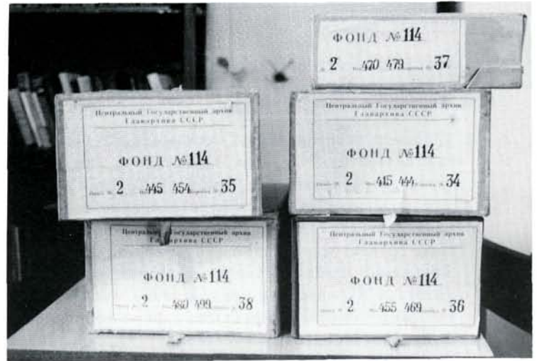
– Fonds 114: het archief van de Belgische vrijmetselaarsloges (meer dan 2.000 dossiers) kan ook voor de geschiedenis van de socialistische beweging relevante gegevens bevatten.

Men was echter het spoor van de resterende oorlogsbuit van boeken en archieven bijster. De hypothese dat onze archieven misschien nog in Duitsland opgestapeld lagen, kon op een bepaald ogenblik enkel nog betrekking hebben op de D.D.R.