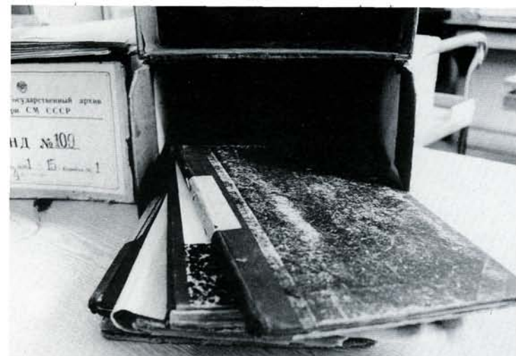
– Eén van de kleinere Belgische archieffondsen: de precieze verslagboeken van de vrijdenkersvereniging l'Affranchissement uit Brussel (1873-1919).