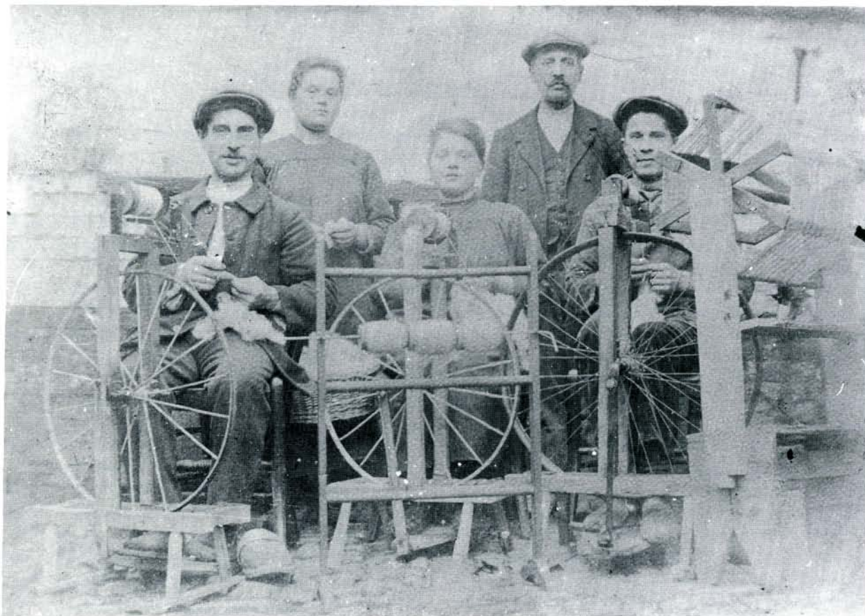
Huiswevers rond de eeuwwisseling.