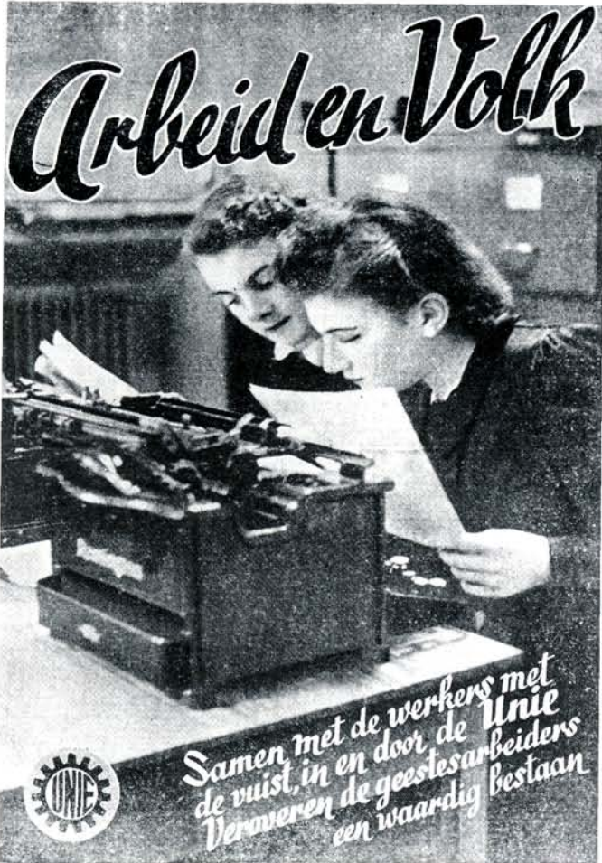
Hoogdagen van het corporatisme : de Unie der Hand- en Geestesarbeiders.